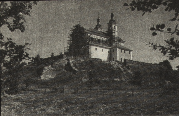
Ryc. 265. Wigry, pow. Suwałki — kościół pokamedulski w czasie prac konserwatorskich w 1955 r.