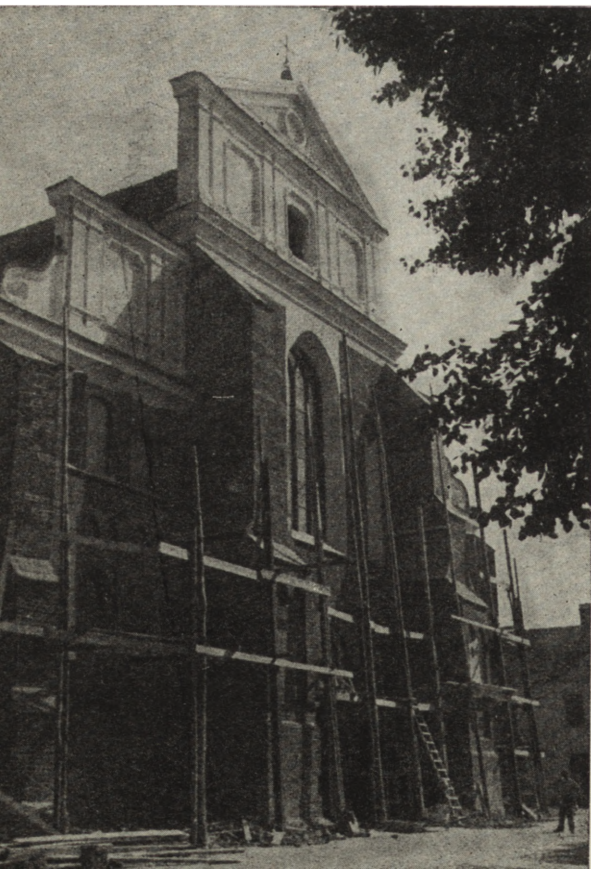
Ryc. 261. Łomża — elewacja frontowa katedry. Stan z 1955 r.

XVII-wieczny Alumnat — dom dla weteranów wojskowych, wymagał uzupełnień i zabezpieczenia murów oraz części pokrycia. Po konserwacji część oddano do użytku.