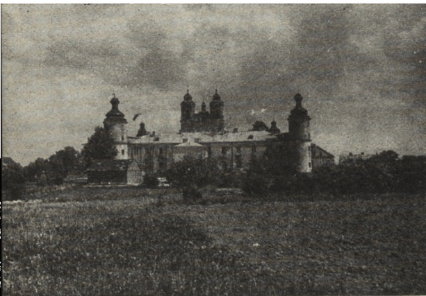
Ryc. 268. Drohiczyn — kościół pofranciszkański po odbudowie. Stan z r. 1955.

czonej więźby dachowej. Prowadzone są też prace przy pokrywaniu hełmów blachą miedziowaną.