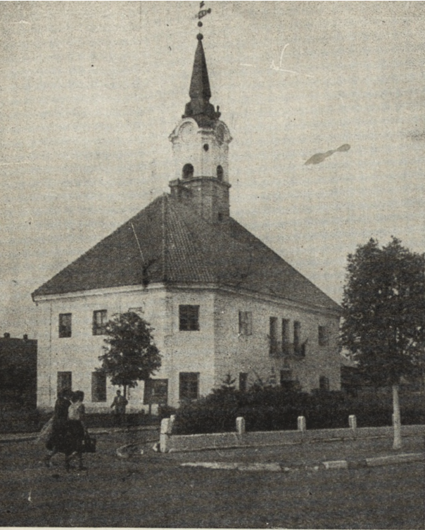
Ryc. 260. Bielsk Podlaski — ratusz. Stan z 1955 r.