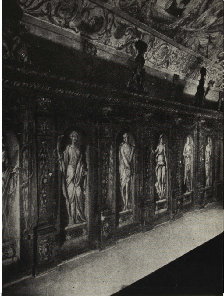
Ryc. 166—167. Fragment szaf depozytowych ozdobionych polichromią (na prawo) i szczegół tej polichromii — alegoria „Pokory”, (na lewo).

wymi pilastrami na wąskie pola, na których widzimy 16 figur alegorycznych kobiecych i męskich, stojących na cokołach (z napisami na tle wnek zamkniętych konchowo); są to idące od narożnika przy oknie wzdłuż ściany dłuższej naprzeciw wejścia następujące alegorie: splendor, sprawiedliwość, roztropność, męstwo, umiarkowanie, pokora, prawda, bogactwo, ubóstwo, pokój, pilność, podstęp, niewinność, łaska, wierność i prawo. Postacie te są otoczone festonami laurowymi. Trzony pilastrów pokrywają festonowe zwisy złożone z kwiatów i owoców, zaś na ich górnych częściach, oddzielonych od kapiteli, znajdują się na przemian główki i rozetki; na cokołach zaś alternują kartusze z maskaronami. Całość wieńczy skromny gzyms, na którym ustawiono sterczyny w kształcie figurek dziecięcych trzymających rogi obfitości oraz wazonów z kwiatami.