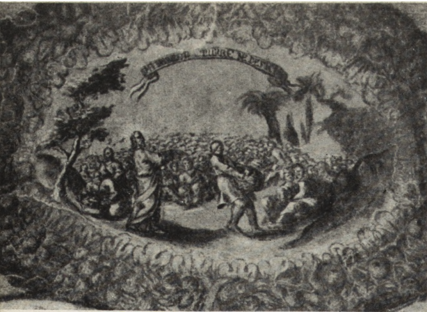
Ryc. 168. Fragment sklepienia sali Arcybractwa, po konserwacji.

województwa krakowskiego 6 . Skarbiec stanowi zabytek jedyny w swoim rodzaju i godny jest opracowania monograficznego.