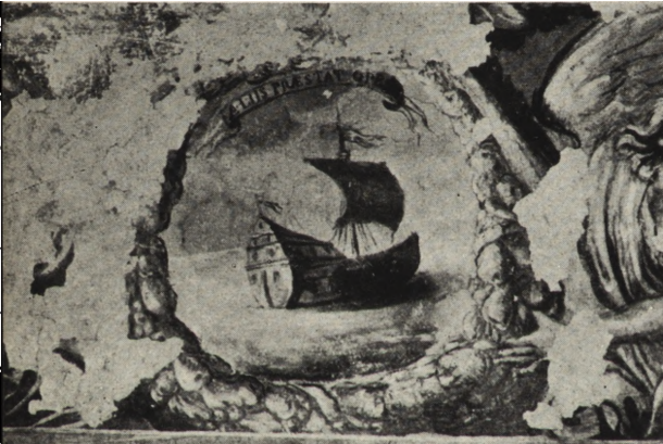
Ryc. 164—165. Kraków — sala skarbcza Arcybactwa Miłosierdzia. Fragment polichromii przed i po konserwacji.

Dopełnieniem tej polichromii i urządzenia wnętrza tak pod względem artystycznym jak i ideowym jest dekoracja malarzka szaf depozytowych, ustawionych wzdłuż trzech ścian (z wyjątkiem okiennej). Tworzą one jednolitą kompozycję o charakterze boazerii, podzielonej hermo-