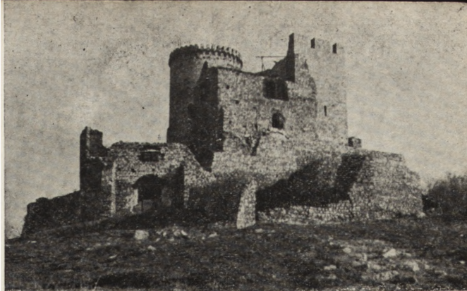
Ryc. 225. Będzin, woj. katowickie. Zamek, elewacja południowa.

ny południowej przylega drugi dziedzińiec na planie nieregularnego trapezu z ujmującymi go budowlami oficyn, wzniesionych w w. XVIII i na przełomie w. XIX/XX. Oficyny łączą się napowietrznym gankiem z oranżerią zbudowaną przy końcu w. XVIII według projektu Piotra Aignera (ryc. 227).