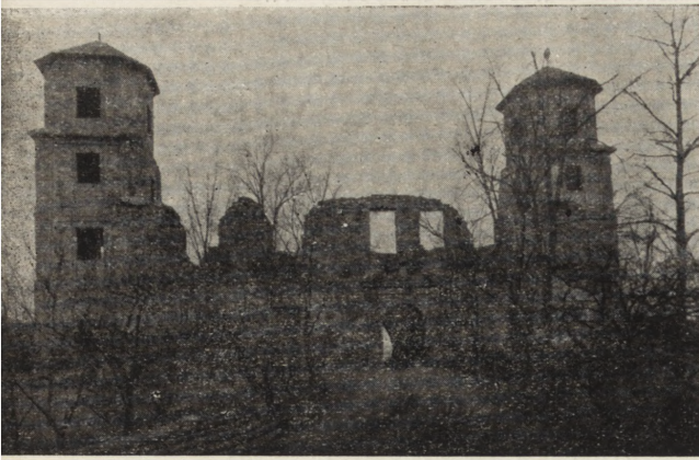
Ryc. 222. Toszek, woj. katowickie, Zamek — elewacja wschodnia skrzydła wschodniego od strony wjazdu.