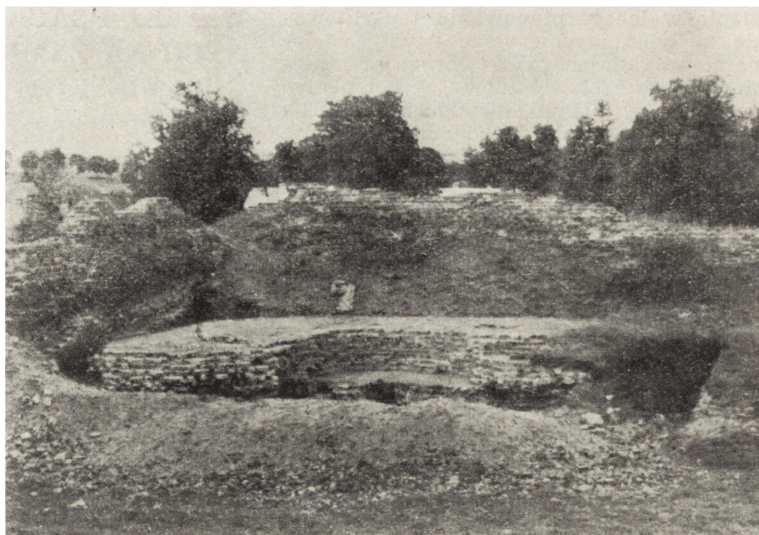
Ryc. 2. Radzyn Chełmiński pow. Wąbrzeźno, „Odślonięta część wieży w północno-zachodnim narożniku dziedzińca”

ograniczającego od zachodu dziedziniec i równoległe do niego, została odślonięta na długości 490 cm zewnętrzna krawędź wieży. Cegły w jej licu zachowanym do wysokości 46 cm tworzyły tzw. „układ polski”. Ta zewnętrzna ściana wieży, w odległości 425 cm od północnego muru otaczającego dziedziniec, załamuje się pod