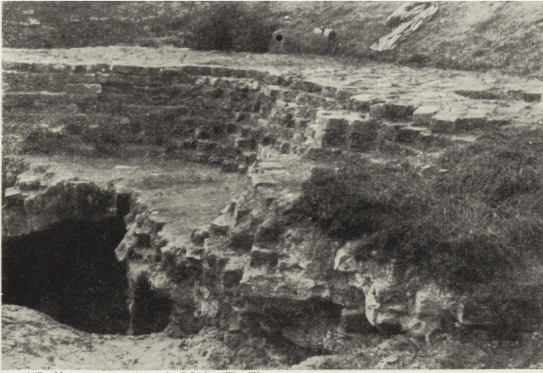
Ryc. 4. Radzyn Chełmiński pow. Wąbrzeźno, „Zniszczona środkowa część wieży oraz lochu”

ułamki, kości zwierzęce, ceramikę oraz ułamki kafli. Ceramika jest jednolita, koloru szaro-stalowego i czarnego, a należy do naczyń toczonych na kole garncarskim. Pod wyżej opisanym ceglany licem ściany wystąpił granitowy cokół wysokości 38 cm. Pod nim widoczne są nieobrobione kamienie łączone zaprawą wapienną.