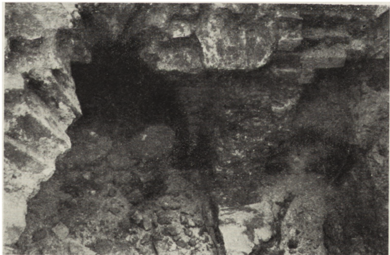
Ryc. 5. Radzyn Chełmiński pow. Wąbrzeźno, „Wnętrze lochu po częściowym usunięciu gruzu”

Południowo-wschodnia część wieży była bardzo zniszczona, tak samo jak i znajdująca się w środku wieży „loch” (Ryc. 4). Loch ten był całkowicie zasypany gruzem. Posiadał on przynajmniej dwa poziomy — „piętra”. Po odgruzowaniu jego części na głębokości 90 cm poniżej istniejącego poziomu muru wieży, wystąpiła równa po-