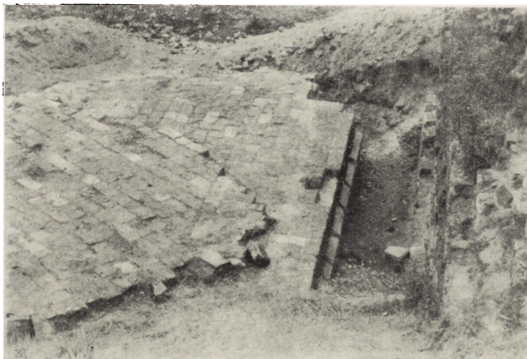
Ryc. 3. Radzyn Chełmiński pow. Wąbrzeźno, „Układ cegieł w murze wieży”

Przestrzeń pomiędzy zachodnim murem dziedzińca a zachodnim licem wieży wyeksplorowaliśmy do głębokości około 100 cm. Wypełnisko składało się z czarnej próchnicy zawierającej całe cegły i ich