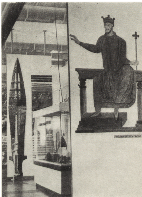
Ryc. 1. Wystawa „Początki Państwa Polskiego” w Państwowym Muzeum Archeologicznym w Warszawie, sala 1. piętra z ekspozycją przedstawienia Mieszka II (wg miniatury) oraz koronacyjnej „włóczni św. Maurycego”