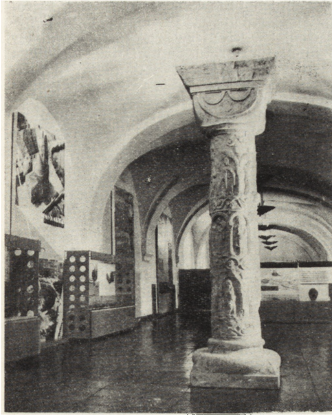
Ryc. 2. Wystawa „Początki Państwa Polskiego” w Państwowym Muzeum Archeologicznym w Warszawie, sala parteru z ekspozycją kolumny ze Strzelna, XII w.