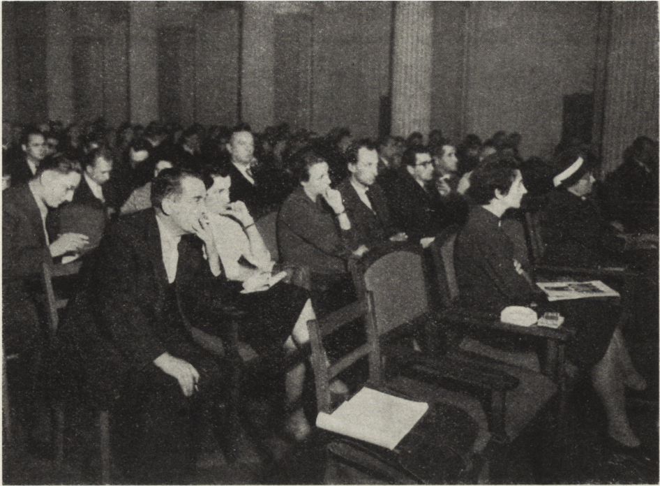
Ryc. 6. Konferencja naukowa poświęcona zagadnieniom konserwacji zabytkowego drewna w dniach 15—16 listopada 1960 r. w Ministerstwie Kultury i Sztuki w Warszawie

Rządowej do Zabezpieczenia Odbudowy i Użytkowania Obiektów Zabytkowych na ogólną liczbę około 26 tysięcy zabytków w kraju zniszczonych było w 1958 roku 12.191 obiektów o średnim procencie zniszczenia 46,6. Dotychczasowe nakłady finansowe na ochronę zabytków wynosiły: w okresach 1945—1949 — 39.325.000 zł; 1950—1955 — 181.039.000 zł; 1956—1960 — 538.921.000 zł.