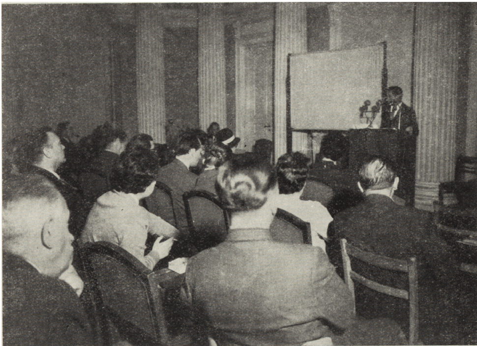
Ryc. 5. Konferencja naukowa poświęcona zagadnieniom konserwacji zabytkowego drewna w dniach 15—16 listopada 1960 r. w Ministerstwie Kultury i Sztuki w Warszawie