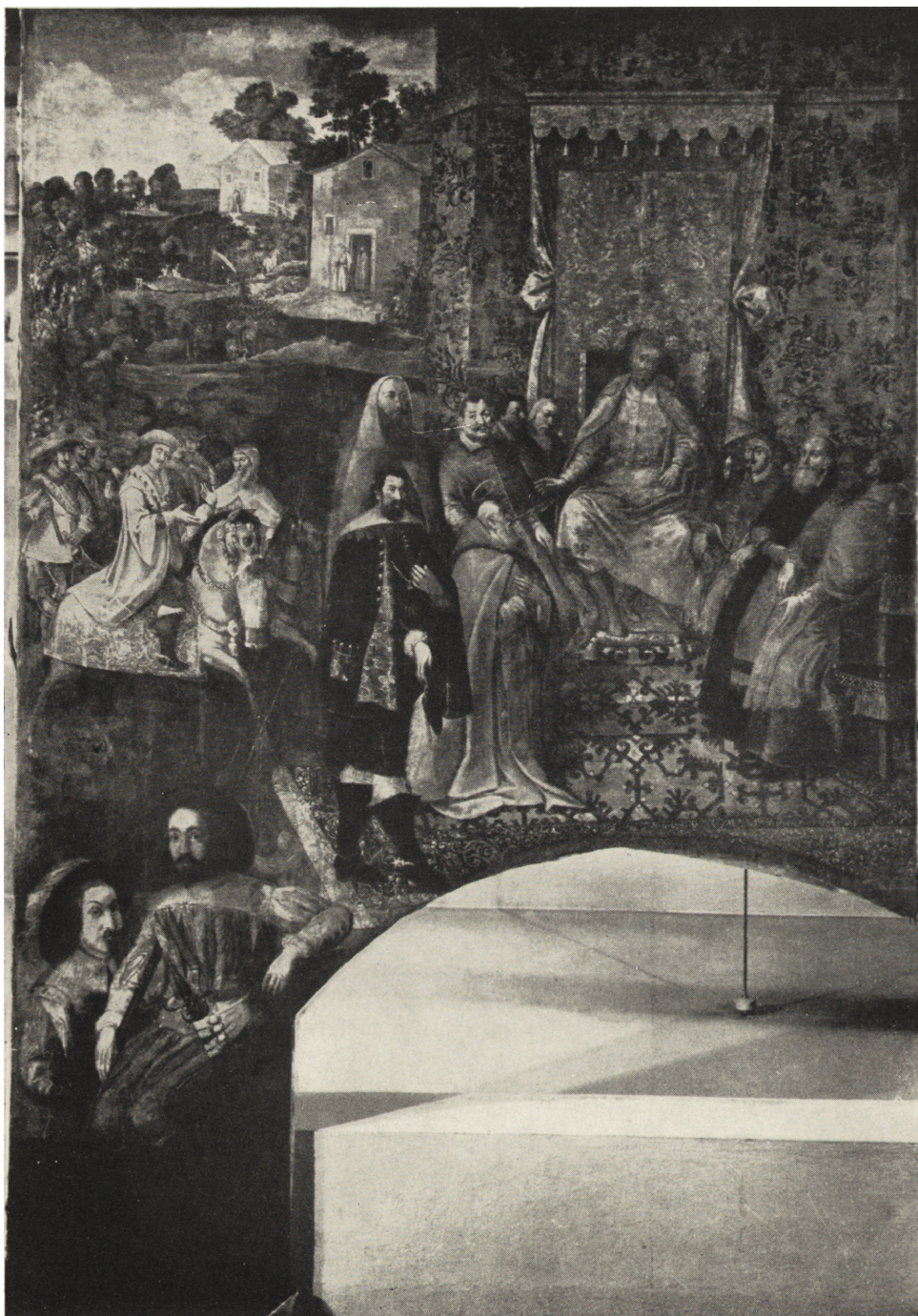
Ryc. 10. Bielany pod Krakowem, kościół oo Kamedułów, obraz z kaplicy św. Romualda ok. 1650 r., stan po konserwacji

usuwano w wielu wypadkach, warstwy przemalowań i rekonstrukcji. Na przykład na obrazie „Odwiedziny św. Romualda u cesarza Ottona” (ryc. 10) dwie widoczne u dołu postacie należą do warstwy późniejszej. Wyjątkowo w scenie „Objawienie się św. Apolinarego św. Romualdowi” zdecydowano się na całkowite usunięcie warstwy późniejszej. Okazało się przy tym, że odsłonięte malowidło, stosunkowo niewiele wcześniejsze od przemalówki, przedstawia kompozycję tej samej treści i o podobnym układzie, ale o zmienionych szczegółach i proporcjach elementów. Pierwotna warstwa malowidła reprezentuje w tym wypadku niższą wartość artystyczną od przemalówki. Można zatem przyjąć, że gdy wstępne badania technologiczne nie dostarczają przekonujących argumentów za usunięciem przemalówki, należy raczej zaniechać tego zabiegu.