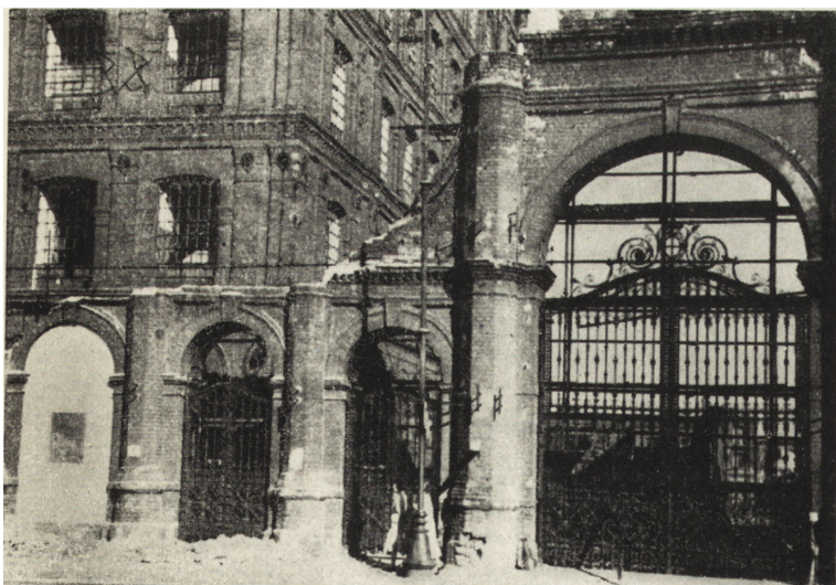
8. Łódź. Brama prowadząca do d. fabryki Poznańskich, ul. Ogrodowa 15. Stan z 1957 r. przed konserwacją