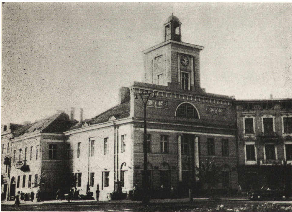
1. Łódź. D. ratusz, pl. Wolności 1. Stan po konserwacji