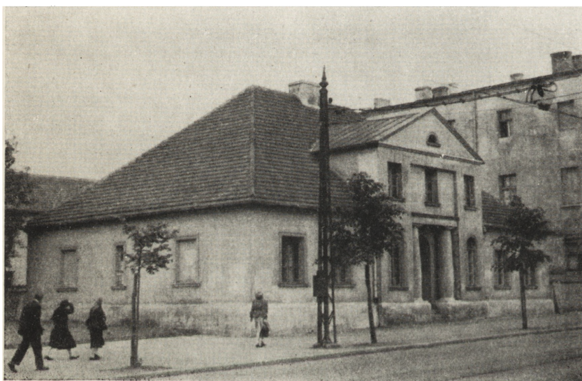
7. Łódź. D. dworek Geyera, ul. Piotrkowska 286. Stan z 1953 r. po konserwacji