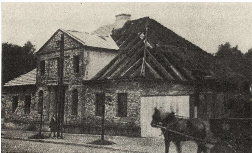
6. Łódź. D. dworek Geyera, ul. Piotrkowska 286. Stan z 1952 r. w trakcie prac konserwatorskich