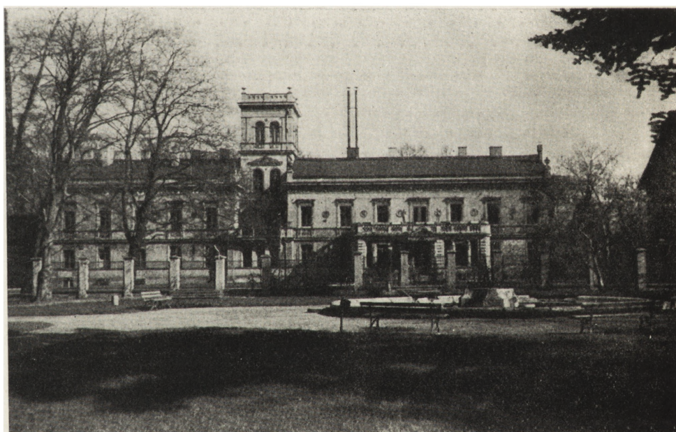
5. Łódź. D. pałac Scheiblerów, pl. Zwycięstwa 1. Elewacja południowa — stan przed konserwacją

Kościół par. św. Antoniego, ul. Okólna (Łagiewniki). Halowy, na planie krzyża łacińskiego, murowany; z XVII/XVIII w., w użytkowaniu zakonu oo. franciszkanów. Do 1959 r. wewnątrz pozostawało w stanie zaniedbania i częściowego zniszczenia. W 1959 r. przystąpiono do remontu z kredytów użytkownika. Wykonano tynki wewnętrzne, zrekonstruowano freski, odremontowano wszystkie ołtarze w liczbie 9 oraz organy z XVIII w. (il. 2). Projekt opracował inż. Kazimierz Pliszka. Roboty wykonano sposobem gospodarczym pod nadzorem konserwatora zabytków.