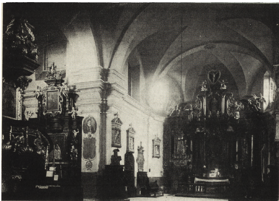
2. Łódź-Łagiewniki. Kościół par. św. Antoniego, ul. Okólna. Widok wnętrza, stan po konserwacji