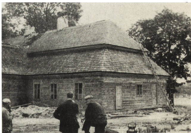
11. Łódź. D. dwór Górskich, n. Zimmermana, ul. Rzgowska 247. Widok częściowy — stan z 1965 r. w trakcie konserwacji