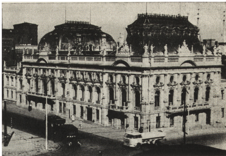
4. Łódź. D. pałac Poznańskich, ul. Ogrodowa 15. Stan z 1964 r. w trakcie remontu dachu.