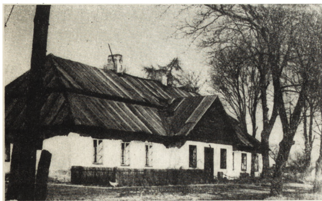
10. Łódź. D. dwór Górskich, n. Zimmermana, ul. Rzgowska 247. Widok ogólny — stan przed konserwacją (fot. Tadeusz Byczko)

Domy mieszkalne, Plac Wolności nr 2, 3, 4, 5, 6, 7. Murowane, z pocz. XIX w. Do 1961 r. elewacje pozostawały w stanie daleko posuniętego zniszczenia. W 1961 r.