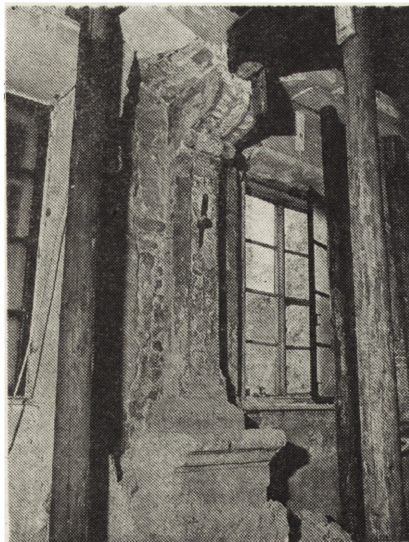
1. Kraków, ul. Kanonicza 7, międzyokienna kolumna renesansowa z 1523 r.

Również w Krakowie, przy ulicy Brackiej 10 odsłonięto późnogotyckie detale architektoniczne. Badania kompleksowe objęły kościół Św. Św. Piotra i Pawła. Te prace zakrojone są na kilka lat i odbywają się z udziałem najwybitniejszych specjalistów konserwatorskich.