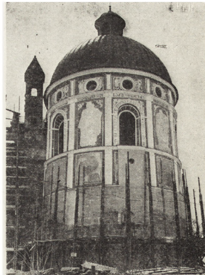
4. Krasiczyn, baszta zamkowa zw. Boską po konserwacji