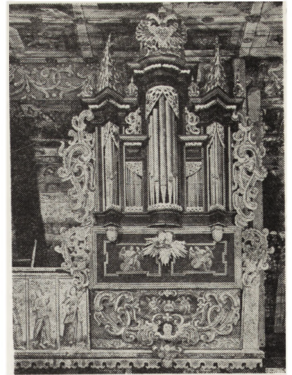
6. Orawka, pow. Nowy Targ, kościół Św. Jana Chrzciciela, odnowione organy z drugiej połowy XVII wieku

W zakresie zabytków ruchomych prace konserwatorskie wykonuje Pracownia Konserwacji Dzieł Sztuki PKZ. W prezbiterium kościoła Bożego Ciała i Św. Marii Magdaleny w Koziegłowach (pow. Myszów) odkryto w 1973 r. gotycką polichromię z XV wieku, przy której trwają prace konserwatorskie. W Książnicach Wielkich (pow. Bochnia) od 1972 r. kontynuowane są prace konserwatorskie przy skrzydłach późnogotyckiego polichromy. W Powroźniku (pow. Nowy Sącz) PKZ konserwują wystrój drewnianej cerkwi z XVII wieku. Dla rozwoju metod utwardzania drewna oraz konserwacji złocień i polichromii istotne są prace przy ołtarzu głównym kościoła Św. Andrzeja w Olkuszu. Pracownia Konserwacji Organów zakończyła już całkowitą konserwację organów z drugiej połowy XVII wieku w kościele Św. Jana Chrzciciela w Orawce (pow. Nowy Targ).