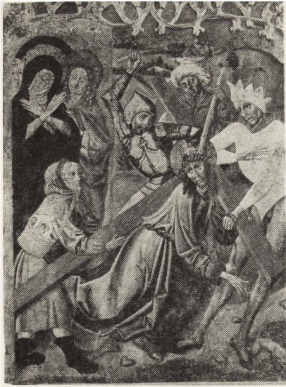
5. Książnica Wielka, pow. Bochnia, kwatery polichromy późnogotyckiej po konserwacji

Oddział PKZ w Krakowie prowadzi prace nad przebudową i adaptacją zamków w Krasiczynie (muzeum i ośrodek wypoczynkowy FSO na Żeraniu w Warszawie) i w Wiśniczu (muzeum i ośrodek wypoczynkowy Ministerstwa Przemysłu Chemicznego).