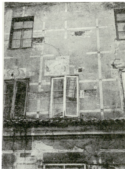
1. Kamienica przy ul. Grodzkiej nr 1, fragmenty odłoniętej dekoracji malarskiej z około 1670 r.

Badania archeologiczne, prowadzone na terenie czterech posesji w obrębie ulic: Złota, W. Pola, Grodzka i Rynek, pozwoliły uchwycić pierwotny poziom użytkowy i odczytać położenie nie istniejącej obecnie zabudowy we wnętrzu bloku. Ponadto w związku z robotami ziemnymi przy ul. Krzywej przeprowadzono na koszt parafii Św. Mikołaja badania ratownicze, które potwierdziły rolę wzgórza „Czwartek” we wczesnośredniowiecznym osadnictwie na terenie dzisiejszego Lublina.