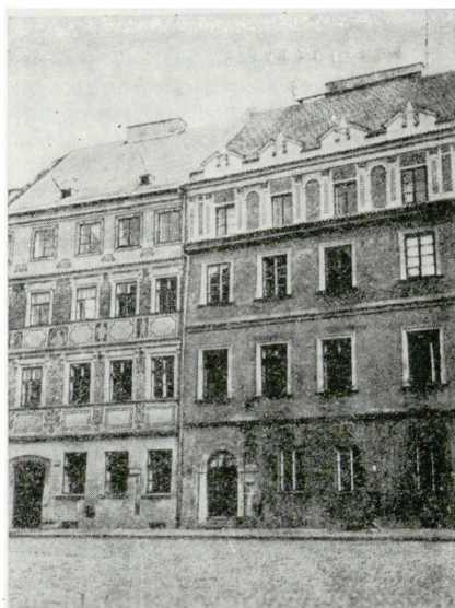
3. Kamienice przy Rynku nr 10 i nr 11 po rekonstrukcji dekoracji sygrafowej

Gmach d. Komisji Obwodowej przy ul. 3 Maja 4. Wzniesiony