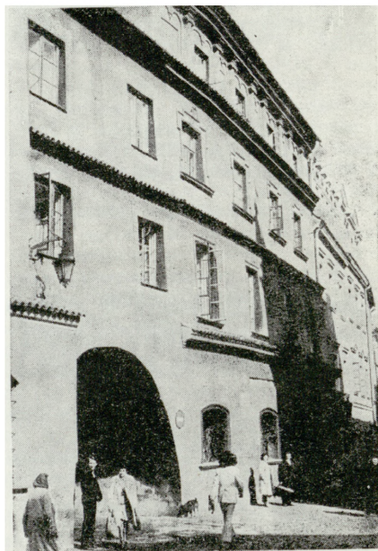
4. Erama Rybna po zakończeniu prac renowacyjnych — widoczne jest spłowienie tynku i słabo już czytelna dekoracja malarska

w 1826 r. według projektu J. Stompha. Obiekt został wyremontowany przez PWRN w Lublinie. Zakres wykonanych prac obejmował odnowienie wnętrza, zainstalowanie centralnego ogrzewania oraz położenie nowych tynków na elewacjach. Gmach Towarzystwa Kredytowego Ziemskiego przy Krakowskim Przedmieściu 43. Po zakończeniu kapitalnego remontu obiektu mieścić się w nim będą reprezentacyjne pomieszczenia Sądu Wojewódzkiego. Obok wymiany instalacji prace we wnętrzu obejmowały reperację ozdobnych posadzek, wymianę stolarki oraz konserwację