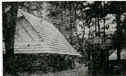
2. Fragment „Zagrody Wsi Pszczyńskiej”

finansową i fachową katowickiego Oddziału Stowarzyszenia „PAX”, Zjednoczonych Zespołów Gospodarczych w Warszawie oraz przemysłu śląskiego. W czasie obrad wielokrotnie wskazywano na ogromną war-