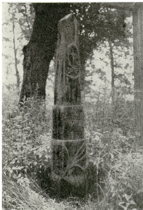
3. Łuszczów, nagrobki na cmentarzu (zdjęcia w artykule J. Langda)