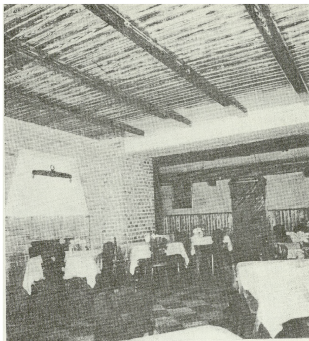
2. Karczów, pałac, jadalnia w piwnicach