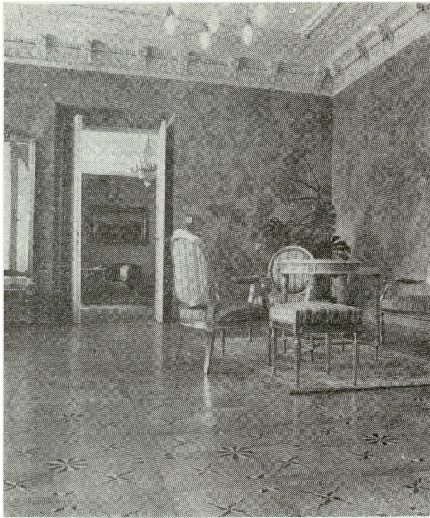
5. Gultowy, szlcznik marmurowy, obecnie recepcyjny