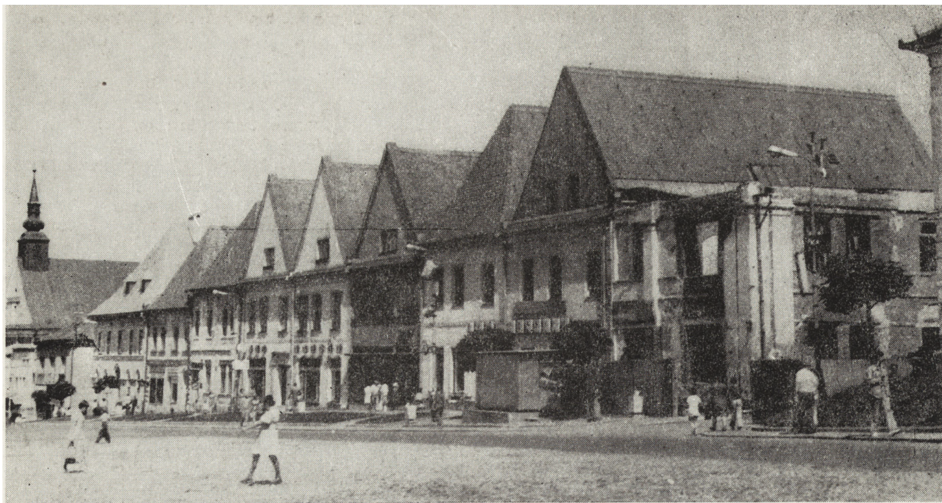
3. Bardejów, wschodnia pierzeja rynku