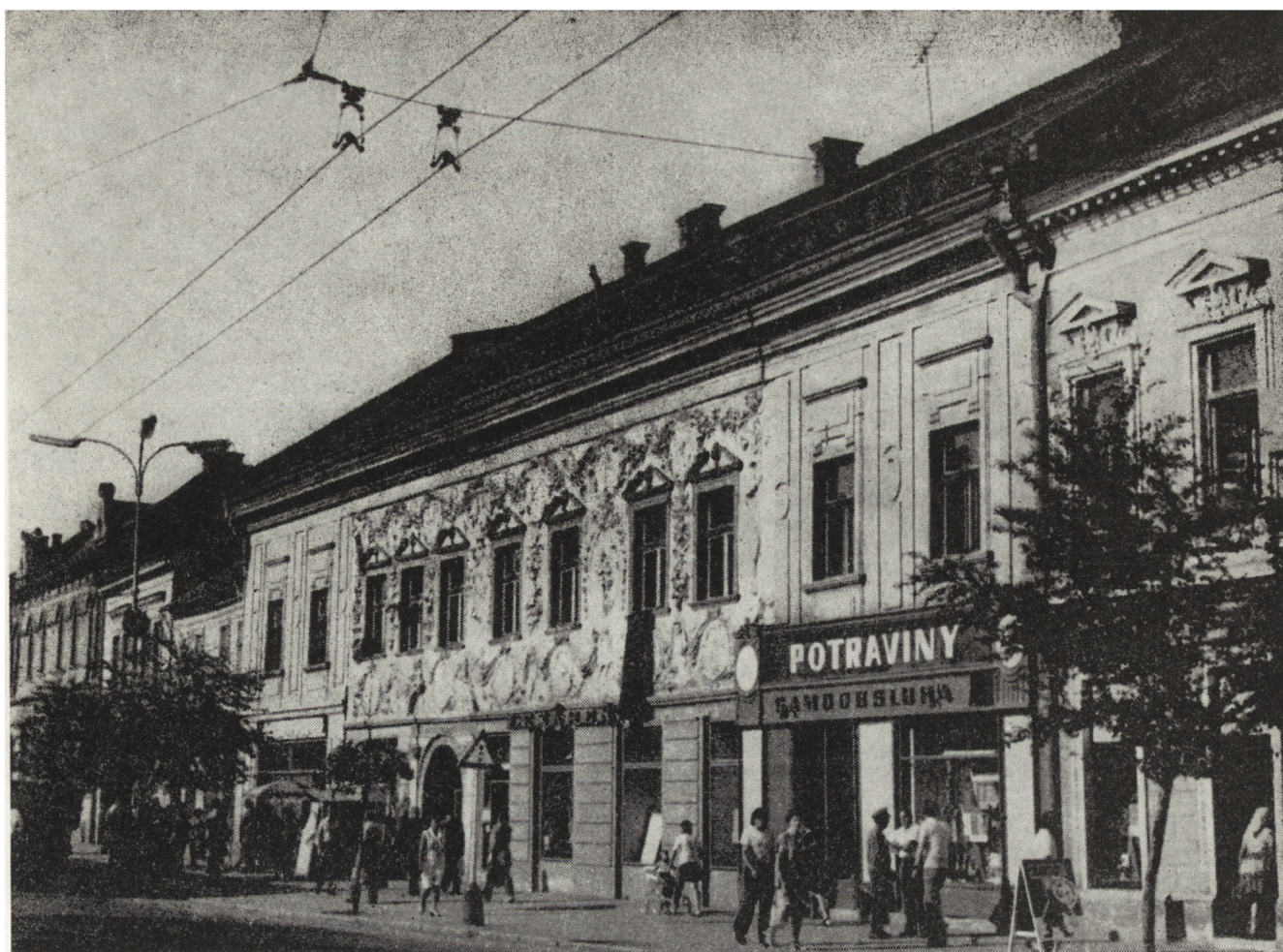
5. Preszów: A — fragment wschodniej pierzei rynku, B — fragment dziedzińca muzeum miejskiego