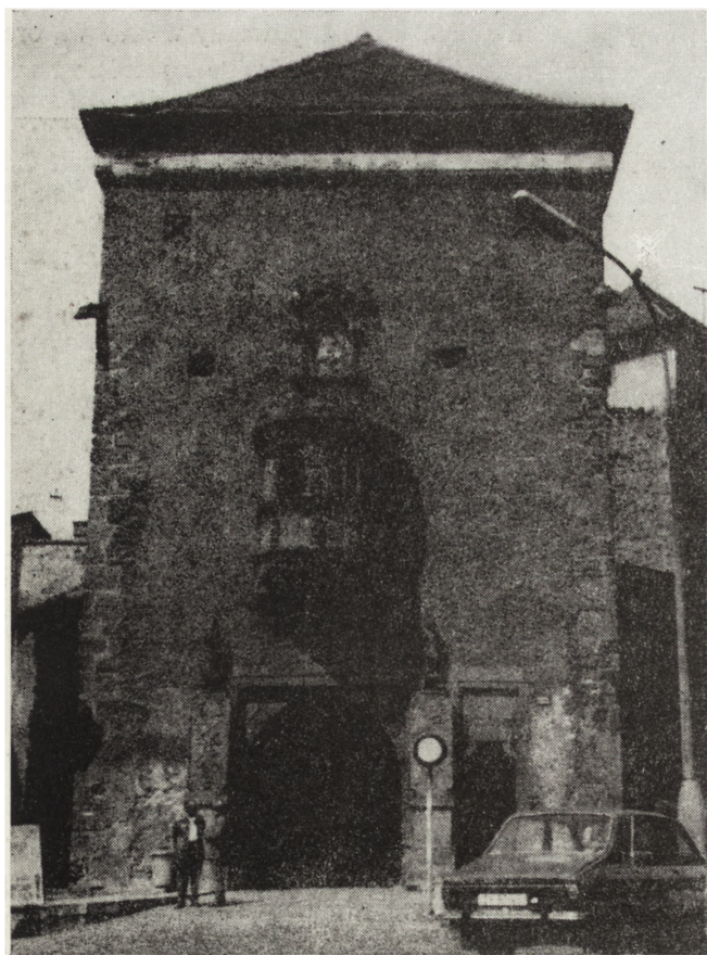
4. Kremnica, town gate