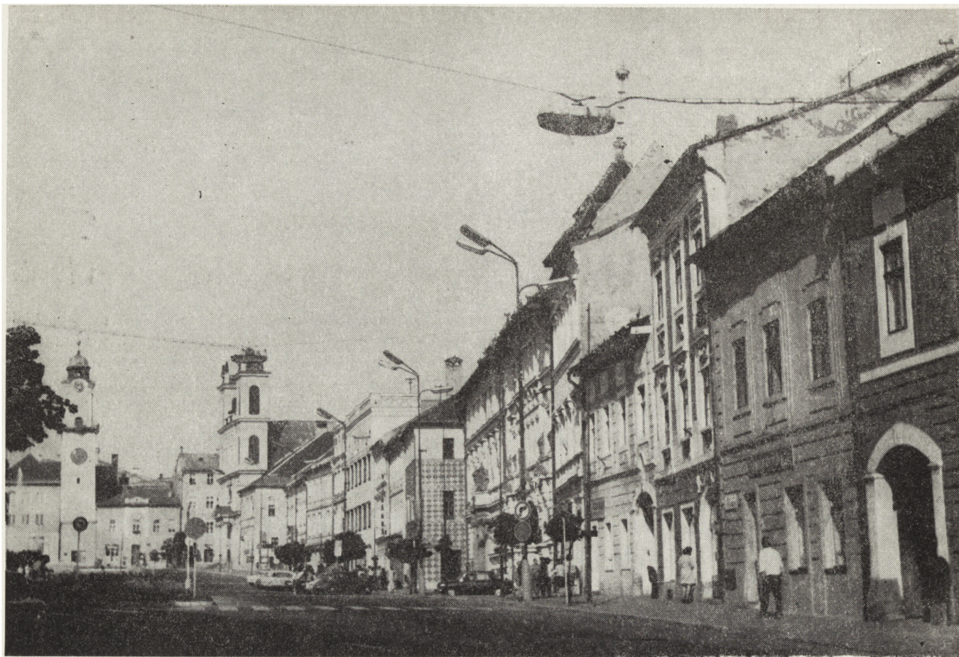
1. Bańska Bystrzyca, południowa pierzeja rynku