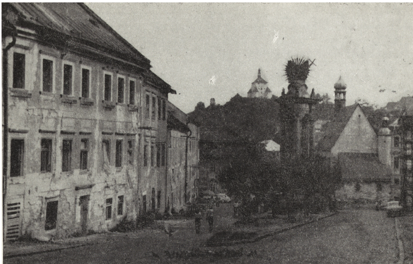
2. Bańska Szczawnica: A — północna pierzeja rynku, B — romańska rotunda na terenie „starego zamku”