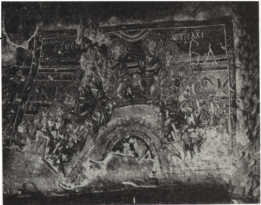
3. Fresk „Zesłanie Ducha Św.” z XIII w. we wnętrzu cerkwi skalnej

1. Pozostawić freski na miejscu; 2. Skonsolidować masyw skalny według przedstawionej w referacie W. Wenkova koncepcji i zabezpieczyć grotę cerkiewne przed opadami i infiltracją wilgoci; 3. Przeprowadzić konserwację i restaurację fresków; 4. Stworzyć strefę ochronną w postaci rezerwatu w rejonie cerkwi skalnych, w przyszłości zagospodarować i udostęp-