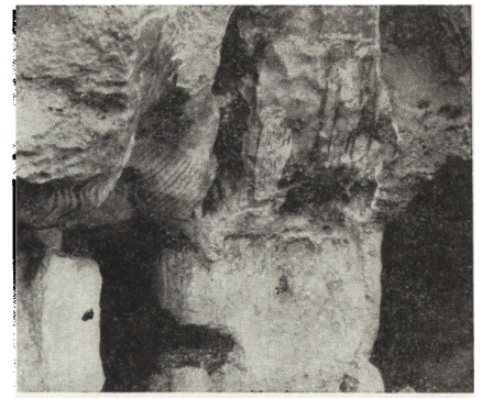
2. Fragment wnętrza cerkwi skalnej z freskami