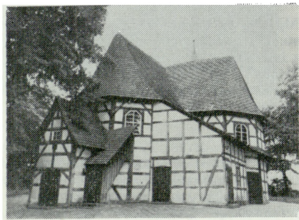
1. Sulów Wielki, kościół Św. Piotra i Pawła z drugiej połowy XVII w.

i jednocześnie przeprowadzenie praktycznego szkolenia jego uczestników pod kątem