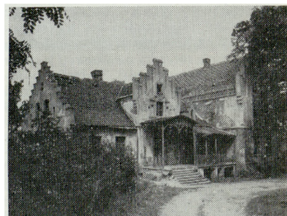
3. Psary, oficyna dworska z pierwszej połowy XIX w.