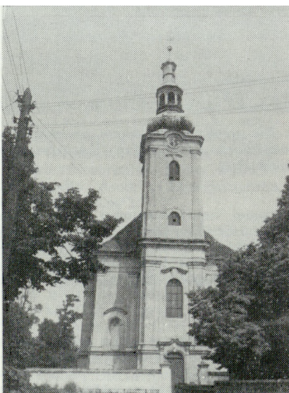
2. Siciny, kościół Św. Marcina (1736—1740), proj. Martin Frantz