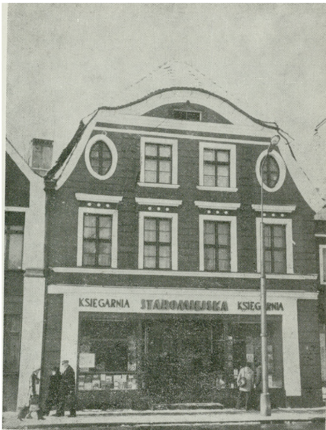
1. Słupsk, kamieniczka z przełomu XVIII i XIX w. — przyszła siedziba WKZ i BBiDZ

Podjęcie działalności merytorycznej przez WKZ, a zwłaszcza BBiDZ, umożliwiły materiały dotyczące zabytków obecnego województwa słupskiego (karty zielone, karty zabytków ruchomych, zespół dokumentacji technicznych, dublety zdjęć zabytków) przekazane przez WKZ w Koszalinie, Gdańsku i Bydgoszczy. Materiały te poddano szczegółowej analizie oraz określono zasady przechowywania, inwentaryzowania i gromadzenia posiadanej i wpływającej dokumentacji. Po zorientowaniu się w stanie ilościowym zabytków założono i przepisano rejestry