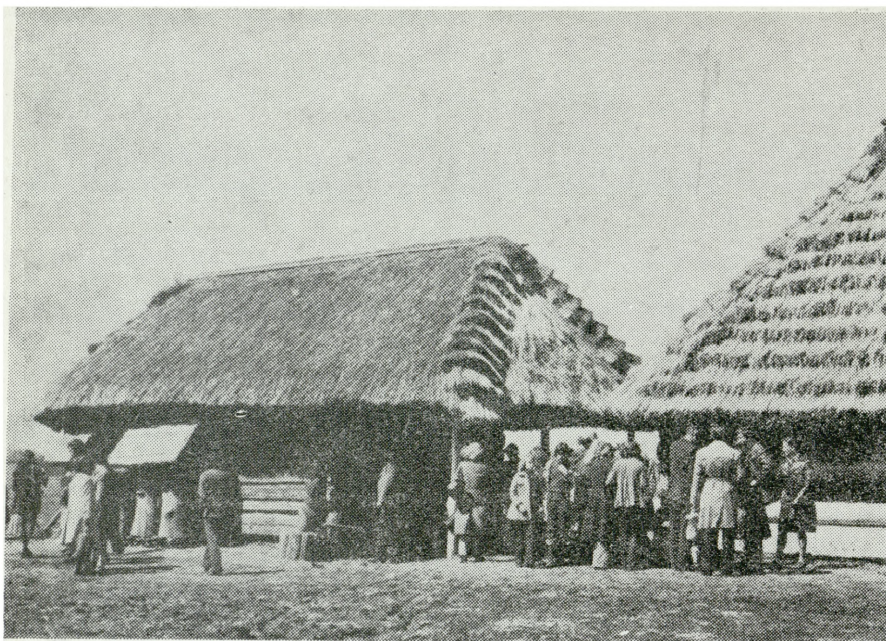
1. Zwiedzanie obiektów Parku Etnograficznego w Kolbuszowej