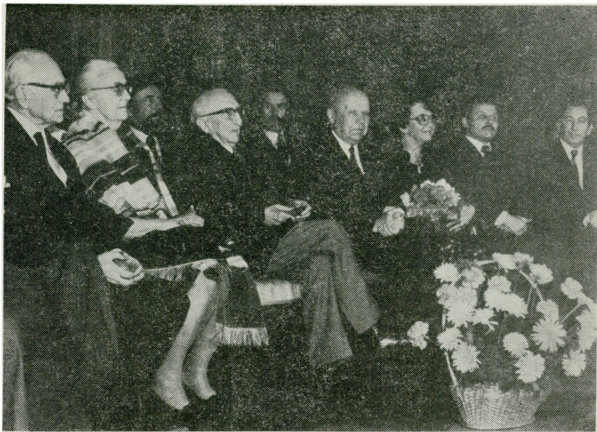
Uroczystość jubileuszowa w Wielkiej Sali Mieszczan'skiej Ratusza w Toruniu

Uroczystości wieczorne zagrał dyrektor Muzeum Okręgowego w Toruniu, mgr Z. Ciara, a Laudatio wygłosił prof. dr St. Lorentz. Następnie wygłoszono przemówienia okolicznościowe oraz odczytano liczne listy i telegramy gratulacyjne. Jubilat otrzy-