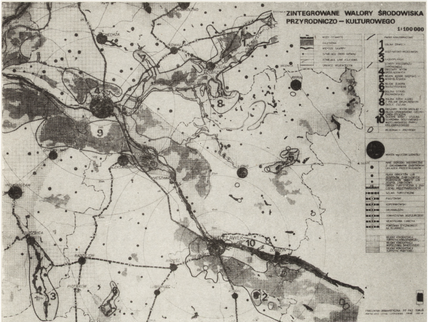
1. Dolina Wisły między Kotliną Płocką i Kotliną Toruńską oraz w rejonie tzw. niecki ciechocińskiej — zintegrowane walory środowiska przyrodniczo-kulturowego