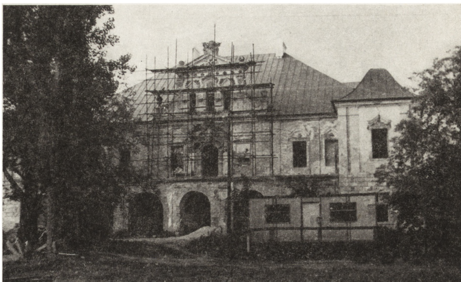
1. Czyżów Szlachecki, pałac z XVIII w., stan w czasie konserwacji

Majdan Królewski (gm. Majdan Królewski) – dzwonnica przy kościele parafialnym Św. Bartłomieja, barokowa, wzniesiona w 1794 r., odnowiona w 1951 r. W 1983 r. parafia przystąpiła do wymiany tynków i pokrycia dachowego na dzwonnicy. Prace prowadzone były na koszt parafii.