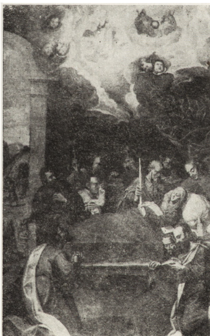
12. Sulisławice, dawny kościół parafialny, obraz „Zaśnięcie Matki Bożej" z ok. 1646 r., stan po konserwacji.

Prace wykonane zostały w latach 1978–1979 przez art. kons. Adama Rachtańna z Krakowa; inwestor: parafia rzymskokatolicka w Łonowie.