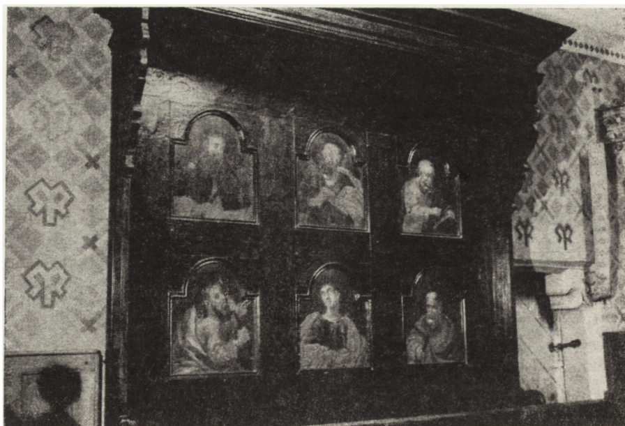
10. Łonów, kościół parafialny, stalle z XVIII w., stan po konserwacji