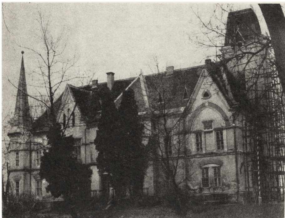
3. Mokrzeszów, pałac z XIX w., stan w czasie konserwacji (fot. D. Komada, 1984)