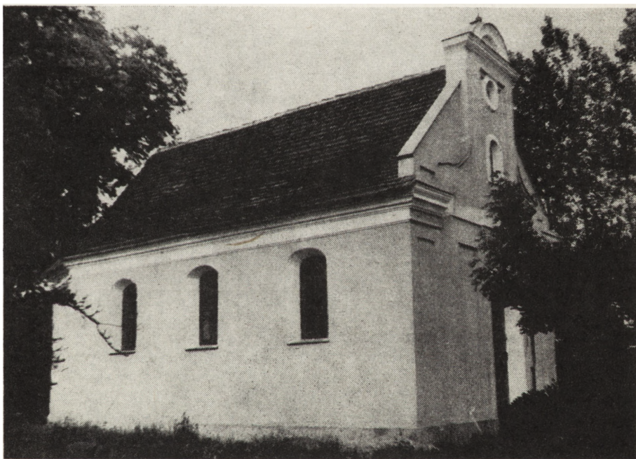
6. Sielec, dawny zbór arikański, obecnie kaplica rzymskokatolicka, z końca XVIII w., stan po konserwacji (1984)