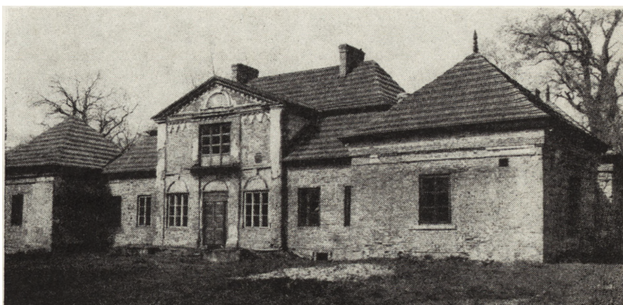
7. Skotniki, dwór z drugiej połowy XVII i końca XVIII w., elewacja frontowa, stan surowy po kapitalnym remoncie (fot. W. Łukaszewski, 1984)