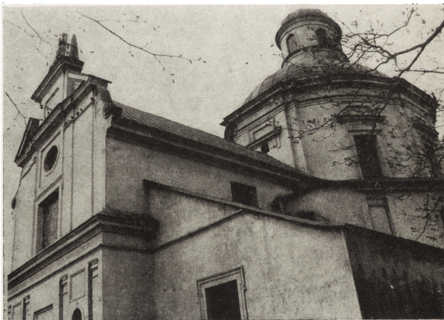
2. Klimontów, kościół pokolegiacki z pierwszej połowy XVII w., stan po konserwacji (fot. W. Łukaszewski, 1984)

wego na dzwonnicy. Prace prowadzone były na koszt parafii.