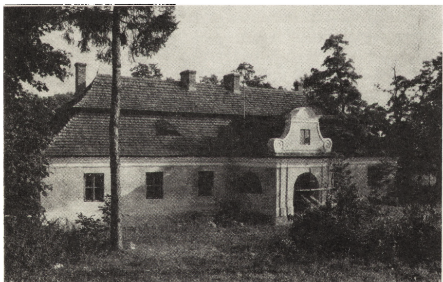
4. Nikisiałka Mała, dwór z XVII w., stan w czasie konserwacji (1984)

w drugiej połowie XVIII w. W 1976 r. art. plastyk Zygmunt Kaczor przystąpił do remontu i adaptacji dworu na cele mieszkalne i galerię rzeźby. Prace remontowe objęły wymianę pokrycia dachowego, tynków, założenie nowej stolarki.