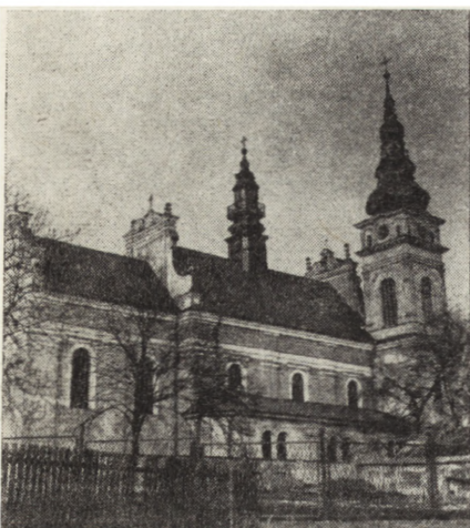
9. Tarnobrzeg, kościół klasztorny dominikanów, obecnie parafialny, z lat 1693–1706 i 1904–1909, stan po konserwacji (fot. D. Komada, 1984)

Janów Lubelski – siedem osiemnastowiecznych obrazów z poddominikańskiego klasztoru: „Matka Boska ukazuje