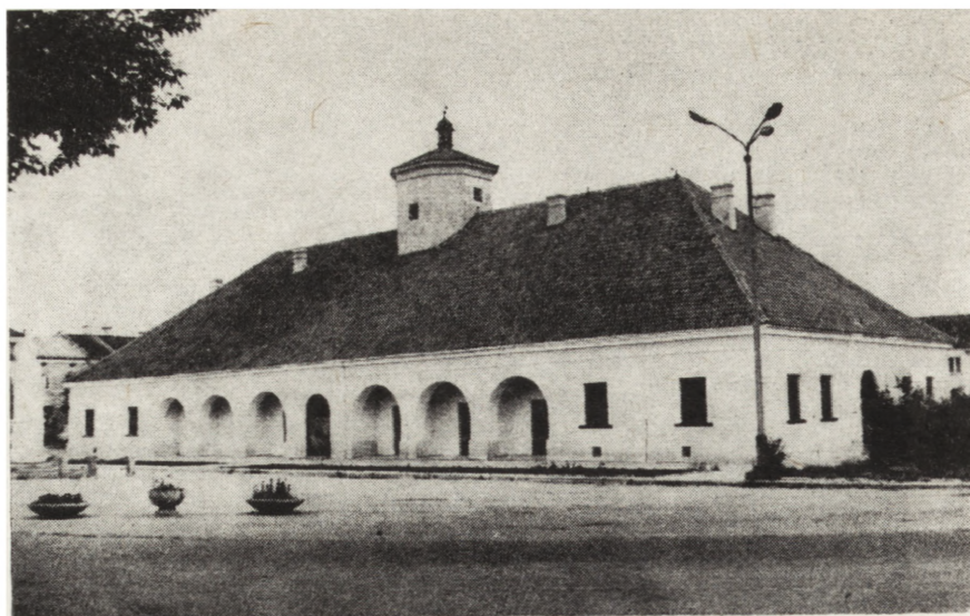
8. Staszów, ratusz-kramice z XVIII w., stan po konserwacji (fot. W. Łukaszewski, 1984)

Bidziny (gm. Wojciechowice) – polichromia sklepienia i ścian nawy i prezbiterium (druga ćwierć XVIII w.) z kościoła parafialnego ŚŚ. Piotra i Pawła. Prace konserwatorskie w zakresie uzu-