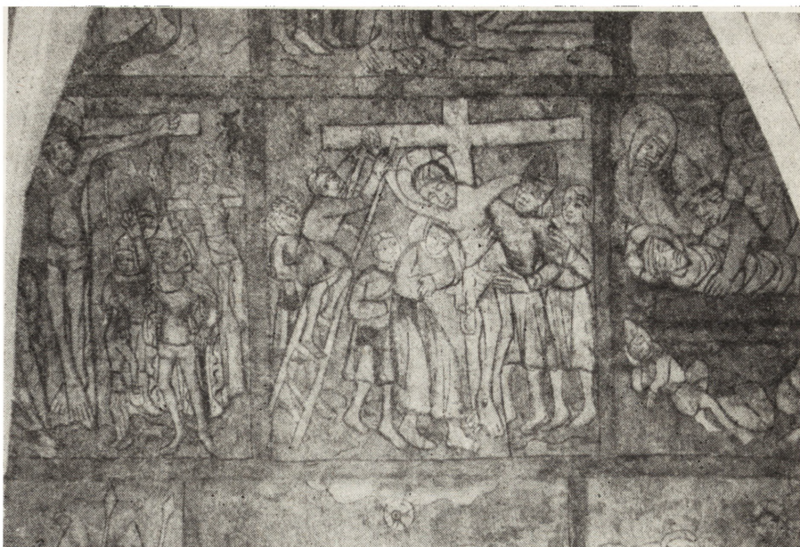
11. Skotniki, kościół parafialny, polichromia z ok. 1370–1380, wschodnia ściana korpusu nawowego, stan po konserwacji

Łonów (gm. Łonów) – stalle drewniane (XVIII w.) z kościoła parafialnego. Wykonano pełną konserwację, obejmującą dezynfekcję, dezynsekcję, petryfikację, rekonstrukcję ubytków drewna stali, likwidację spaczni i spleśni. Z malowideł usunięto zanieczyszczenia, uzupełniono ubytki przez punktowanie oraz sprasowanie istniejących odspoin.