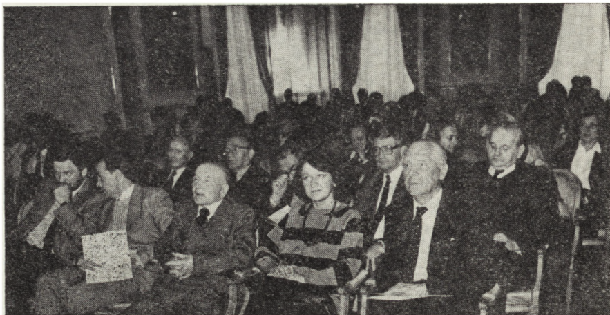
2. Uczestnicy jubileuszowej sesji