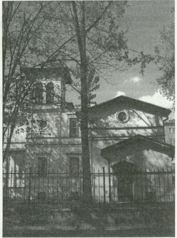
2. Willa Struwego w Warszawie — siedziba TOnZ. Fot. B. Kędzierzawska, 1994 r.

Zgodnie z wnioskami przyjętymi na Walnym Zebraniu Delegatów TOnZ, w 1992 r. zorganizowana została przez Towarzystwo Międzystowarzyszeniowa Komisja Legislacyjna, która opracowała propozycje poprawek i uzupełnień do nowelizowanej ustawy Prawo Budowlane o zapisy dotyczące bardziej skutecznej ochrony zabytków architektury i krajobrazu kulturowego. Komisja zgłosiła także postulat przygotowania nowej ustawy o konserwacji zabytków,