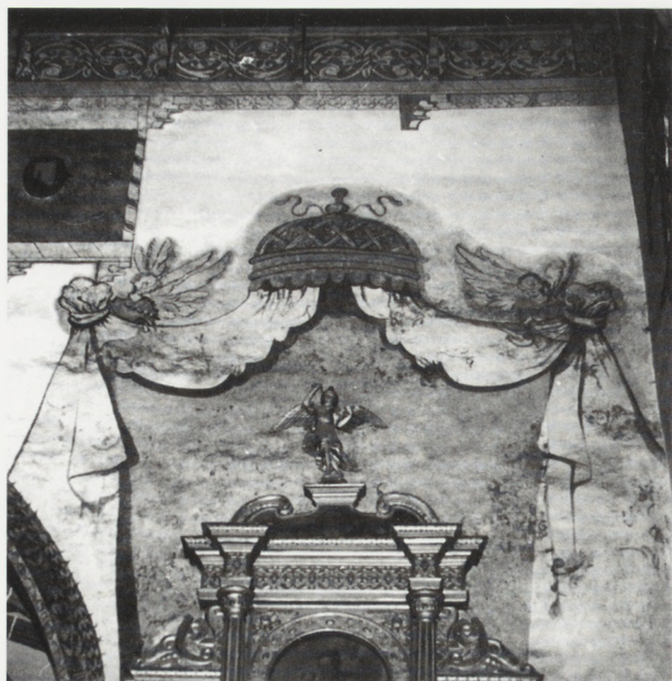
5. Szydłowiec. Kościół parafialny p.w. św. Zygmunta. Polichromia na południowej części ściany tęczowej — baldachim. Stan po odsłonięciu w l. 1978–1980.