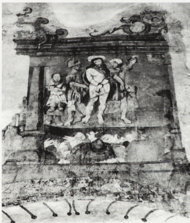
3. Szydłowiec. Kościół parafialny p.w. św. Zygmunta. Polichromia — „Biczowanie”. Stan po odsłonięciu w l. 1978–1980.

11. Ks. B. Przybyszewski, Stanisław Samostrzelnik , „Biuletyn Historii Sztuki”, R. XIII, 1951, nr 2–3, s. 47–87.