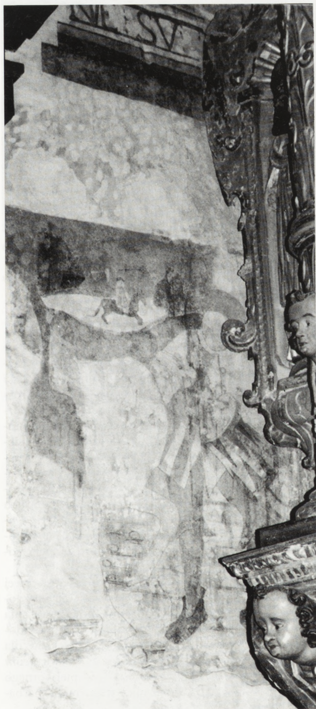
1. Szydłowiec. Kościół parafialny. p w. św. Zygmunia. Polichromia — „Droga na Kalwarię”. Stan po odsłonięciu w l. 1978–1980. Fot. W. Puget 1996