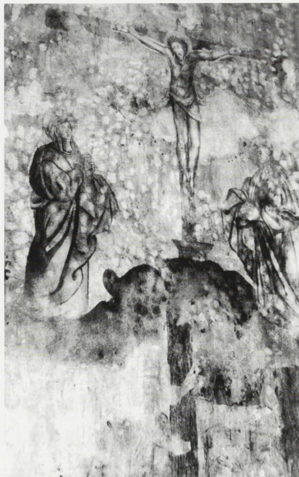
4. Szydłowiec. Kościół parafialny p.w. św. Zygmunta. Polichromia — „Ukrzyżowanie”. Stan po odsłonięciu w l. 1978–1980. Fot. W. Puget 1996

Mikołaj, podskarbi koronny, wykończył kościół farny w Szydłowcu zdobiąc jego szczyty herbami kutymi w piaskowcu. „Sufit wysoko odpowiednimi kolorami i złotem wymalować kazał” (przemalowany przez Ludwika Konarzewskiego w XX w.), ufundował ołtarz główny (przerobiony z wykorzystaniem bocznych kwater), stalle (zachowane niewielkie fragmenty), chór dla śpiewaków (przerobiony) z podniebieniem wypełnionym kasetonami z motywem wirujących rozet (również przerobionymi) i wiele innych przedmiotów dokumentowanych herbami. Na szczególną uwagę zasługuje sformułowanie w Liber... : „przy drzwiach pierwszych od wejścia (od strony północnej) Chrystusa obciążonego krzyżem z orszakiem żalobnym (...) idącym na Kalwarię, tamże w środku świątyni wizerunek Chrystusa zawieszzonego na krzyżu pomiędzy lotrami”. Malowane na tynku wyobrażenia „lotrów” zachowały się na podłuczcu tęczowym, także krucyfiks pierwotnie umieszczone na belce tęczowej. Sformułowania te za-