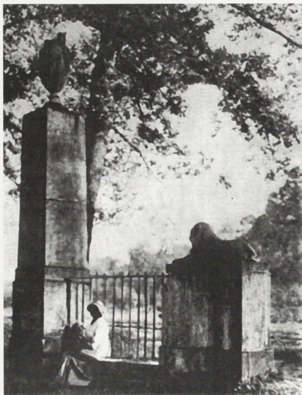
4. Obelisk z urną i „lewek egipski” przy wejściu do Gaju wg fot. z 1915 r.

4. Obelisk with an urn and an „Egyptian lion” at the entrance to the Grove; acc. to photo from 1915