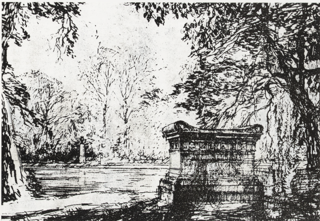
6. Widok sarkofagu i obelisku z Gucina na terenie ogrodu w Wilanowie. Rys. H. Dąbrowski