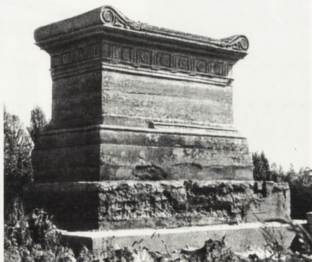
5. Sarkofag w Gaju. Fot. G. Ciolek, 1948

Ukształtowana za obeliskiem silnie zadrzewiona część Gaju tworzyła zwarty maszyn różnych gatunków drzew sadzonych jako pamiątki-pomniki, dając jednocześnie przyćmiony ich koronami nastrój i miejsce dla innych, pomniejszych pomników wznoszonych tu przez różne osoby. Poza obeliskiem przy wejściu ustawiono parę innych takich kamiennych obiektów z odpowiednimi nazwiskami bądź imionami wrytymi na każdej ze ścian. Nawiązywały one swym charakterem