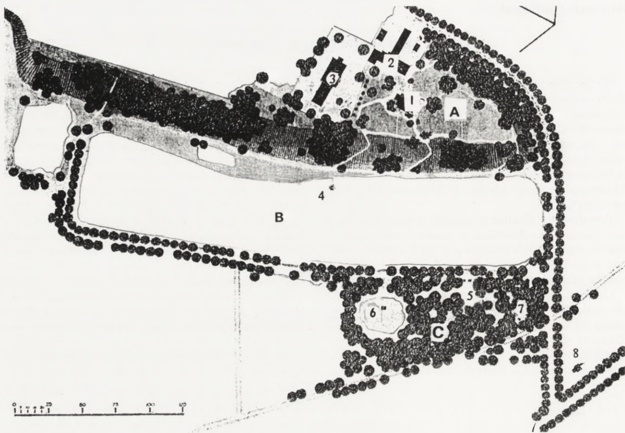
2. Gucin, rekonstrukcja stanu ok. 1830 r. wg oprac. L. Majdeckiego: A — ogród na wzgórzu; B — staw; C — Gaj; 1 — dworek; 2 — oficyny; 3 — kościół; 4 — altana; 5 — wejście do Gaju z obeliskiem z urną i „lewkiem egipskim”; 6 — sarkofag; 7 — obelisk Mostowskich; 8 — stróżówka 2. Gucin, reconstruction of the state from about 1830, acc. to L. Majdecki: A — garden on hillock; B — pond; C — Grove; 1 — manor; 2 — outbuildings; 3 — church; 4 — gazebo; 5 — entrance to the Grove with an obelisk, an urn and an „Egyptian lion”; 6 — sarcophagus, 7 — the Mostowski obelisk; 8 — keeper's lodge

mebli mahoniowych, znajdowały się rysunki w złoconych ramach. W pokoju „do sypiania” poza meblami był portret Aleksandra „cesarza i króla”, kopia Balińskiego z Magdaleny Correggia , figurki Hebe i Ganimeda z „pasty porcelanowej” oraz popiersie Apollina Belwederskiego, a na ścianach rysunki w ramach złoczonych. Urządzenie gabinetu „pąsowego” składało się z umeblowania, z pająka z jaja strusiego oprawnego w brąz złocony, portretu Napoleona i kopiersztychów kolorowanych. W pokoju kredensowym była zastawa stołowa na kilkanaście osób 3 .