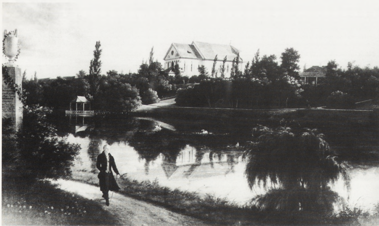
1. Widok Gucina, mal. W. Kasprzycki. Pośrodku kościół św. Katarzyny, po prawej dworek S. K. Potockiego, po lewej altana i obelisk z urną, Muzeum Narodowe w Warszawie.

Według inwentarza sprzętów, sporządzonego 14 października 1821 r. (czyli w miesiąc po śmierci Stanisława Kostki) dworek składał się z sieni, pokojów: „do kompanii”, „do sypiania” i „białego”, gabinetu „pąsowego”, garderoby, pokoju jadalnego w oficynie i pokoju kredensowego. W pokoju „do kompanii”, oprócz