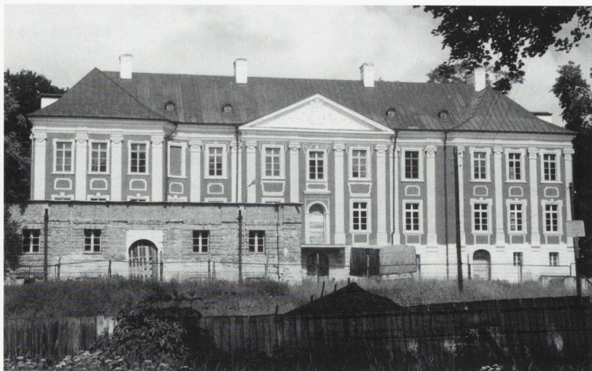
Wielka, pałac Sapiechów — fasada po konserwacji.