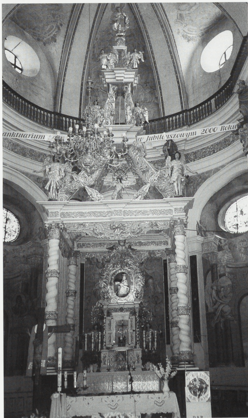
Skrzatusz, kościół parafialny p.w. Wniebowzięcia NMP — ołtarz główny po konserwacji.

Polichromie w prezbiterium przedstawiające sceny z dziejów cu- downej Piety , którą sprowadzono do Skrzetusza z Mielęcina, dawny i obecny kościół, postać fundato- ra świątyni — z ok. 1698 r.