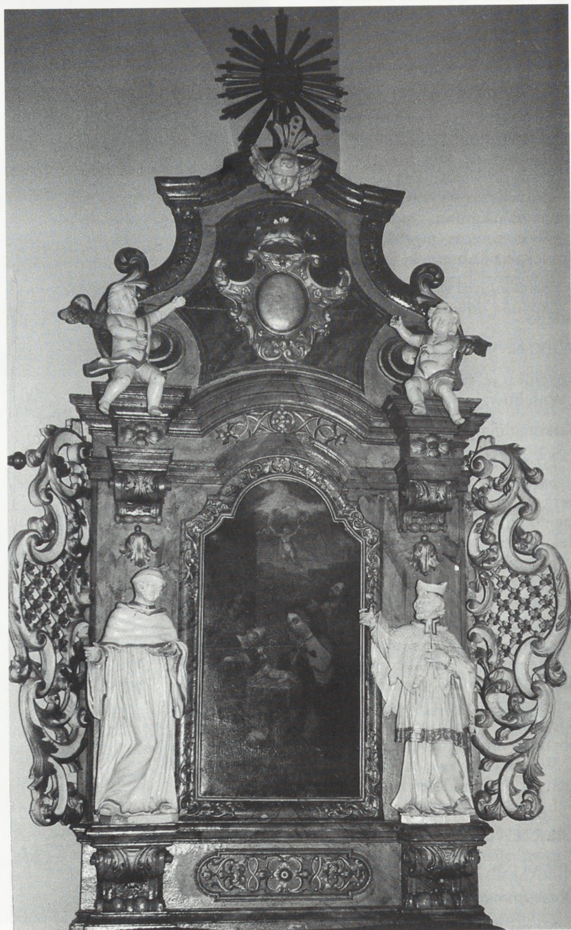
Chociszewo, kościół parafialny p.w. św. Jana Chrzciciela — ołtarz boczny.