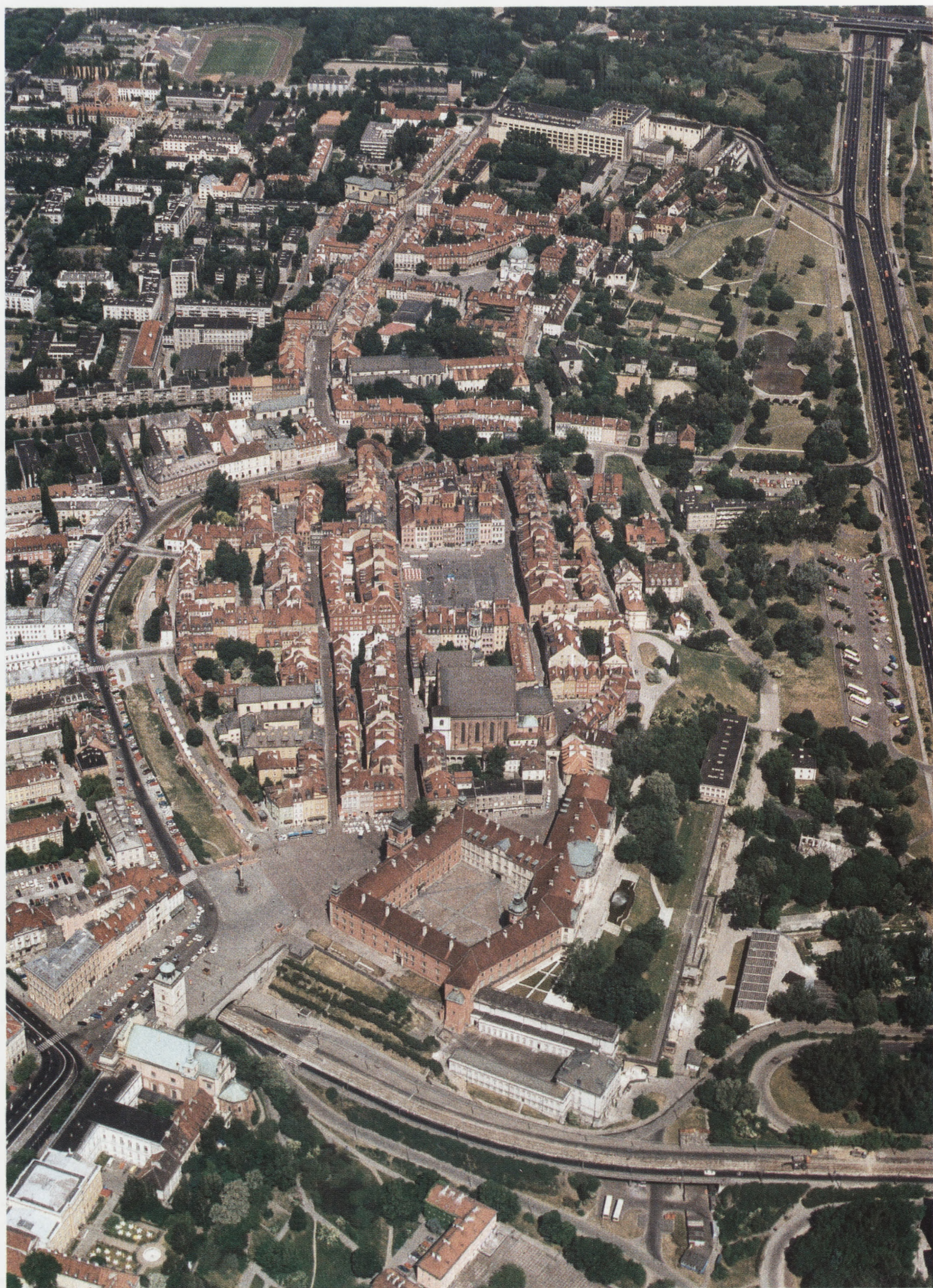
Warszawa, Stare i Nowe Miasto od strony południowej. Zdjęcie lotnicze, ODZ neg nr 1-1-3. Fot. W. Stępień, 1992 Warsaw, Old and New Town from the south. Aerial photographs, ODZ negative no. 1-1-3. Photo: W. Stępień, 1992