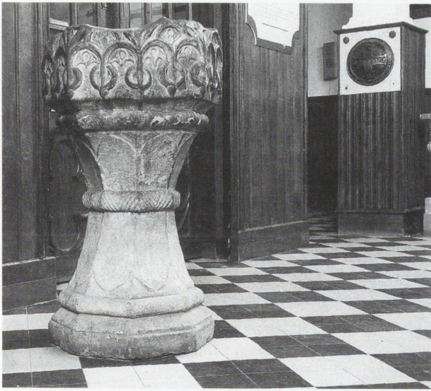
Gotycka chrzcielnica z 1482 r., o pięknej kielichowej formie, dekorowana maswerkami — w kościele parafialnym w Grójcu. Jedno z nielicznych takich dzieł na Mazowszu.

Gothic baptismal font from 1482, with a splendid chalice form, decorated with tracery — in the parish church in Grójec. One of few such works in Poland.