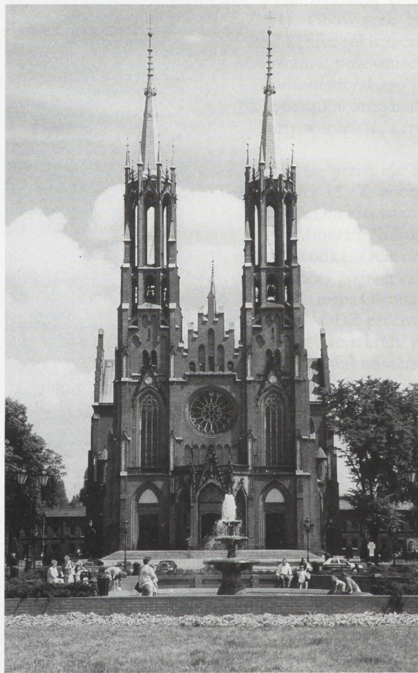
Zyrardów — kościół parafialny zbudowany w latach 1900–1903 według proj. Józefa Piusa Dziekońskiego. Monumentalna świątynia — jedna z największych neogotyckich na Mazowszu, ozdobiona pięknymi secesyjnymi witrażami — jest wizytówką miasta. Kościół wzniesiony w centrum miasta, przy rozległym placu, stanowi element interesującego założenia urbanistycznego, które powstało przy zakładach włókienniczych.

Od początku pracowała w Zespole grupa historyków sztuki i konserwatorów-zabytkoznawców, ale także etnograf i architekt. Z czasem ci dwaj ostatni odeszli, a przybył archeolog. Tak jak pozostałe Regionalne Ośrodki, Zespół sam przygotowywał własny program badań i stworzył nowy warsztat pracy. Każdy z pracowników otrzymał swoje zadanie, np. urbanistyka miast mazowieckich, budownictwo dworskie i sakralne czy też budownictwo wiejskie. Oprócz tego przy-