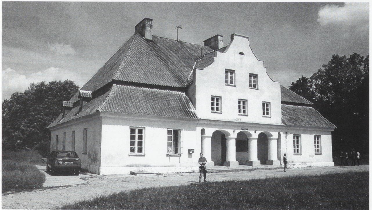
Bęckowo (pow. grajewski) — dwór wzniesiony w latach 1752–1760, obecnie szkoła. Piękna bryła z wyniosłym mansardowym dachem, regularny, trójdzielny plan z dwoma wglębnymi portykami sytuują ten obiekt w grupie najciekawszych barokowych dworów Mazowsza. Dawna mazowiecka ziemia wiska, w której leży Bęckowo, znajduje się obecnie w województwie podlaskim.

W ciągu dziesięciu lat pracy stworzyliśmy własną fototekę dokumentującą krajobraz kulturowy regionu i mamy zaczątek archiwum map i planów kartograficznych oraz pomiarów zabytków architektury. W latach 1996–1999 przejęliśmy archiwum kilku warszawskich oddziałów Przedsiębiorstwa Państwowego Pracowni Konserwacji Zabytków. Jego inwentaryzacja jest przewidziana na kilka lat, gdyż liczący kilkadziesiąt tysięcy jednostek zbiorów był w dużej mierze nieuporządkowany, miał inwentarze dla kilku niewielkich zespołów, a dla zdecydowanej większości brakowało jakiegokolwiek inwentarza. Z naszej wiedzy i doświadczenia zawodowego oraz zgromadzonych w siedzibie zbiorów korzystają studenci, architekci i konserwatorzy, którzy szukają materiałów do prac studialnych i projektowych.