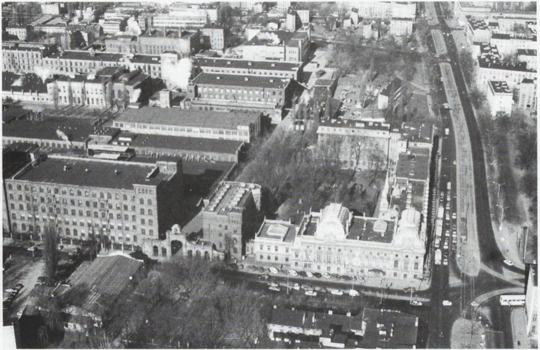
Łódź — dawne zakłady I. K. Poznańskiego, obecnie w palacu mieści się Muzeum Historii Miasta Łodzi. Fot. W. Stępień, 1994 Łódź — the former I. K. Poznański works; today the palace is the seat of the Łódź Historical Museum. Photo: W. Stępień, 1994