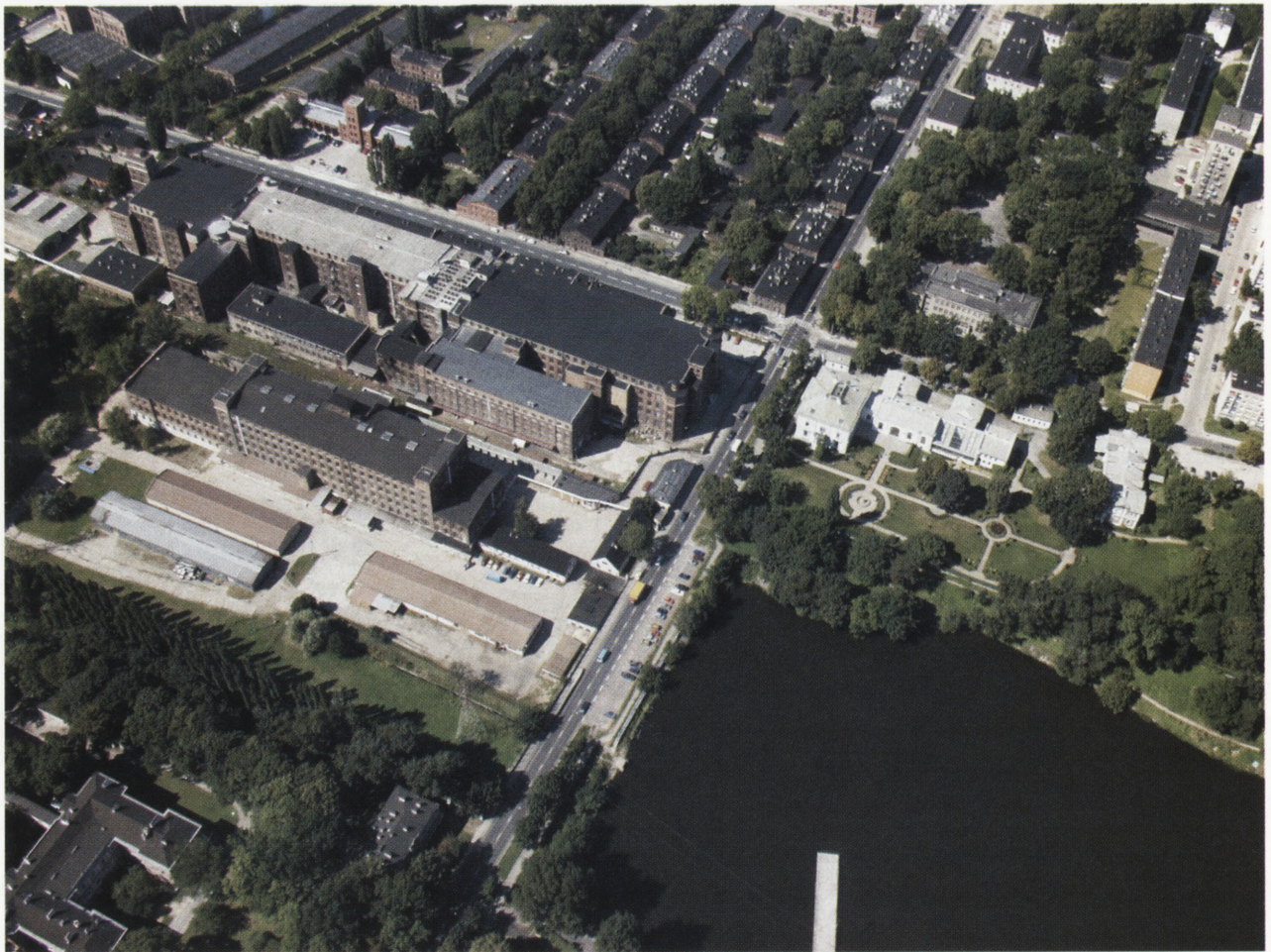
Zespół fabryczno-rezydencjonalny Księży Młyn, zakłady Scheiblera — przędzalnia, willa Herbsta, obecnie muzeum wnętrz. Fot. W. Stępień, 2001 The Księży Młyn factory-residential complex, the Scheibler works — spinning mill, the Herbst villa, today: a museum of interiors. Photo: W. Stępień, 2001

tewską i regionem kiejdańskim, gdzie w latach 1997–2001 prowadzono wspólne dokumentacje terenowe związane z małą ojczyzną Czesława Miłosza i miejscowymi polonikami. Program ten realizowaliśmy wspólnie z Regionalnym Ośrodkiem w Toruniu. Najnowszym efektem współpracy była zorganizowana w 2001 r. międzynarodowa sesja naukowa z udziałem uczestników z krajów bałtyckich poświęcona wspólnemu dziedzictwu. W trakcie sesji zorganizowano ekspozycję fotograficzną zdjęć autora w Ośrodku Kultury im. Czesława Miłosza. Obecnie przygotowywane jest wspólne z Regionalnym Ośrodkiem w Toruniu wydawnictwo albumowe pt. Ziemia ojczysta Czesława Miłosza .