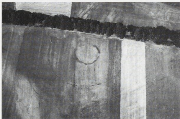
Rąpice w woj. lubuskim — osada obronna z wczesnej epoki brązu. Fot. W. Stępień, 1999

Ośrodek Regionalny w Łodzi działa od 1 lipca 1991 r. Zakres naszych zainteresowań i pracy określony został przez program resortowy „Synteza kulturowych wartości przestrzeni państwa polskiego”. Terytorialny zasięg działania obejmuje ziemię łęczycko-sieradzką, praktycznie jest to obszar obecnego województwa łódzkiego.