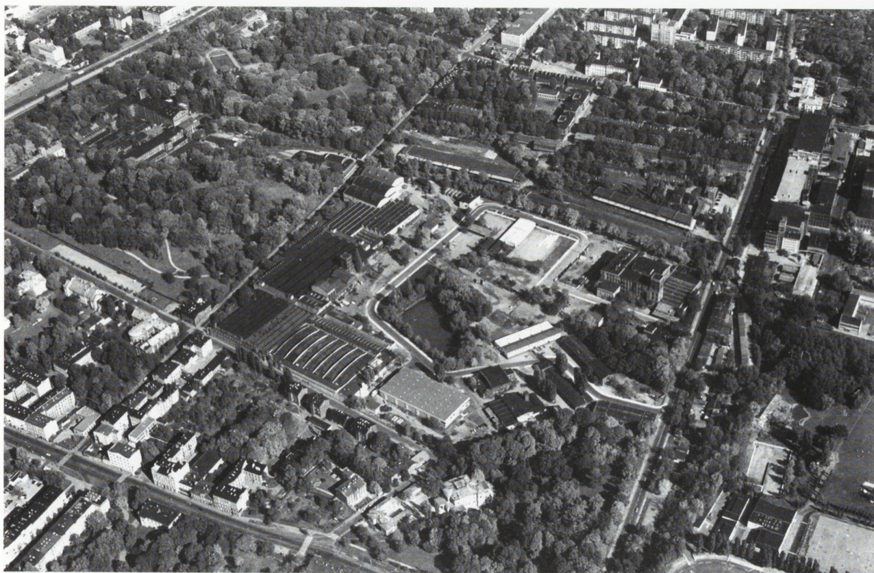
Księży Młyn — zakłady Scheiblera–Grohmana. Na pierwszym planie Łódzka Specjalna Strefa Ekonomiczna. Fot. W. Stępień, 2000 Księży Młyn — the Scheibler–Grohman works. In the foreground: the Łódź Special Economic Zone. Photo: W. Stępień, 2000

Osiedla Robotniczego, tzw. Księżego Młyna, którego założenie jest unikalne w skali Europy. W wyniku prezentacji Księży Młyn został wpisany na listę najbardziej cennych 100 zabytków przemysłowych świata, a Łódź stała się obiektem zainteresowania specjalistów chcących zorganizować tutaj następną sesję naukową.