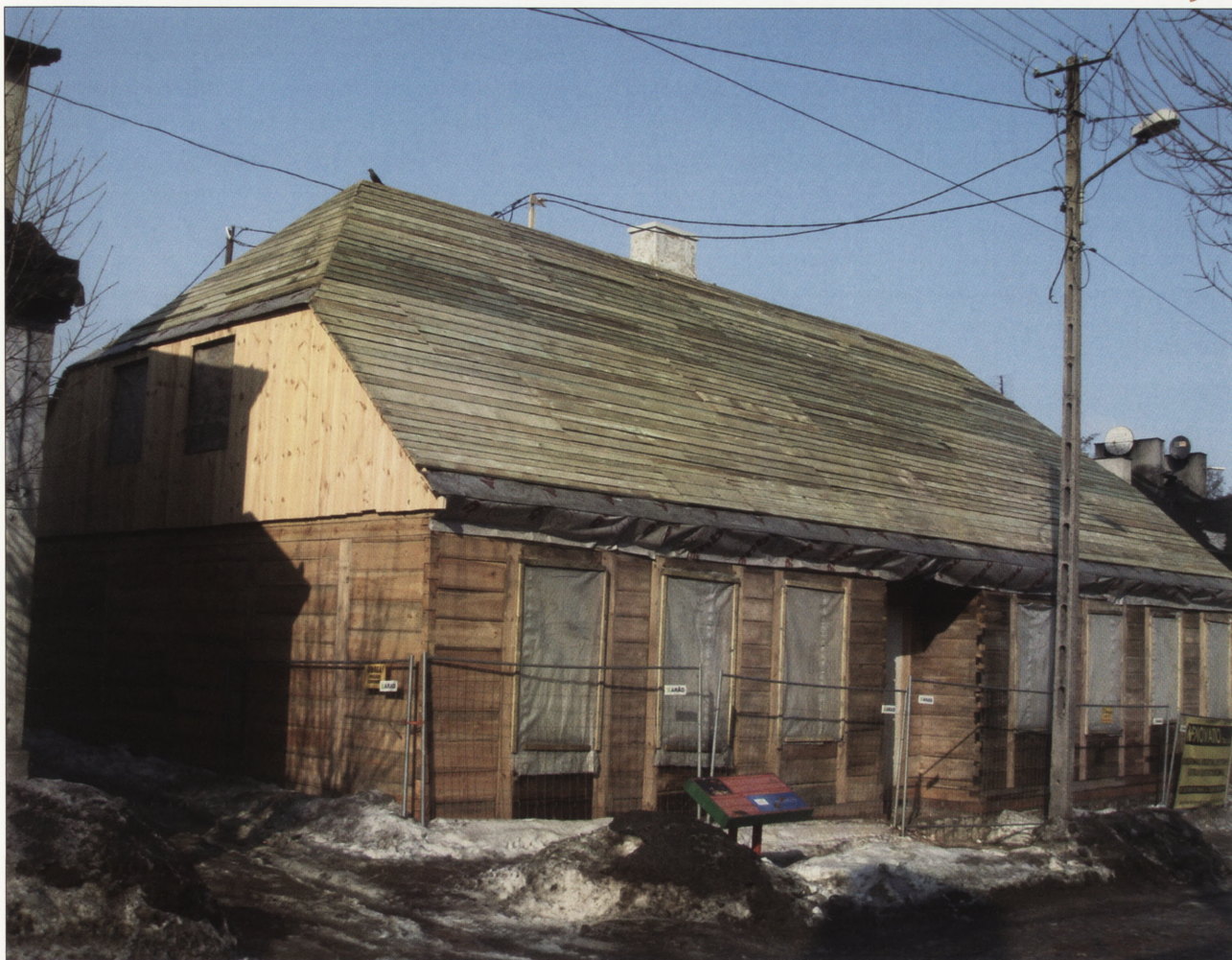
7. Dom przy ul. Narutowicza 6, prace konserwatorskie, luty 2010 r. 7. House in 6 Narutowicza Street, conservation work, February 2010.

na tym terenie, w której właścicielem ponad 50 proc. nieruchomości było miasto, przemawiała na korzyść realizatorów programu, zaś od determinacji samych wykonawców zależało prawidłowe i skuteczne wykorzystanie przysługujących im odpowiednich instrumentów prawnych.