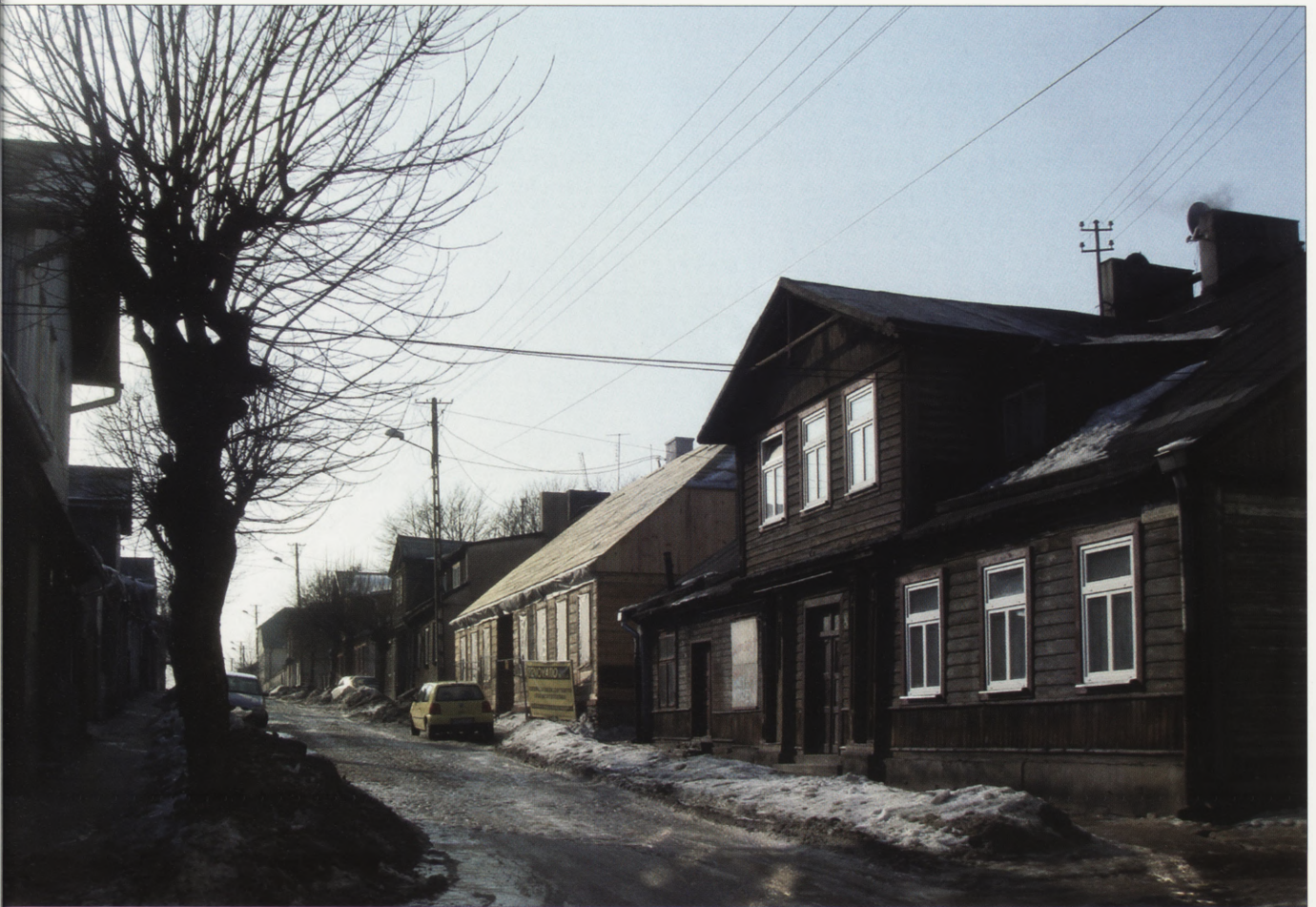
5. Ulica Narutowicza, widok od strony ul. Rembowskiego, po prawej stronie w głębi widoczny złożony po pracach konserwatorskich dom tkacza przy ul. Narutowicza 6, luty 2010 r.