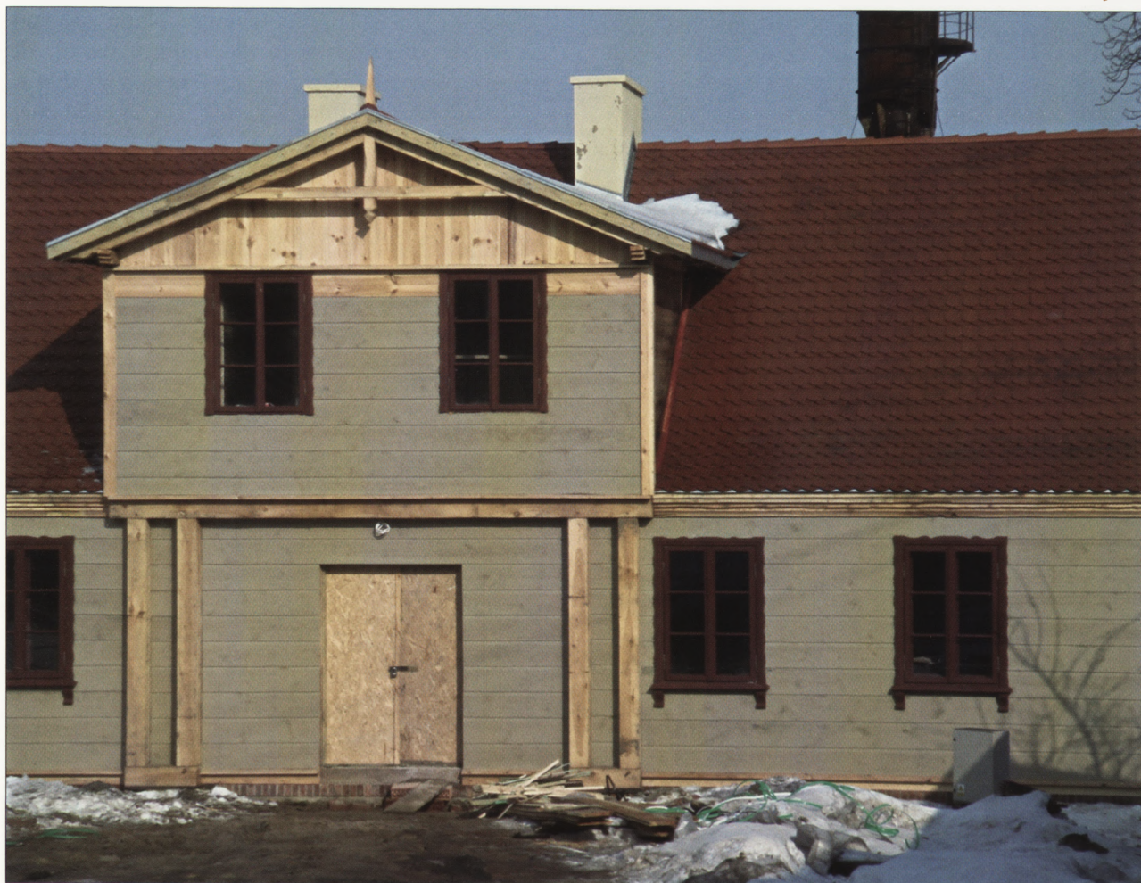
8. Dom tkacza przeniesiony z ul. Dubois 7 na ul. Rembowskiego 1 i pokryty dachówką, luty 2010 r.