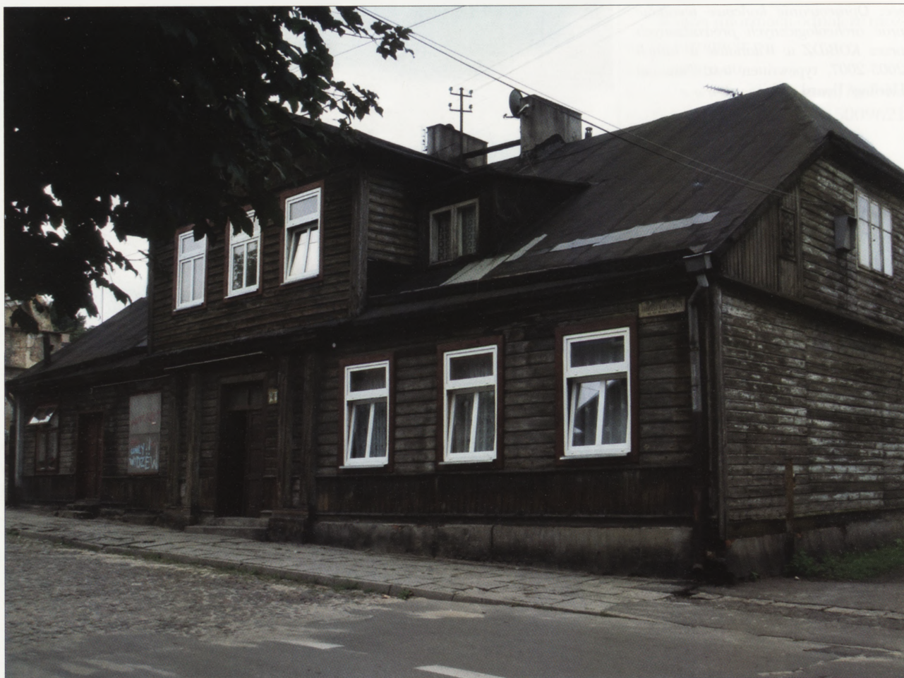
1. Dom przy ul. Narutowicza 4, sierpień 2009 r. 1. House in 4 Narutowicza Street, August 2009.