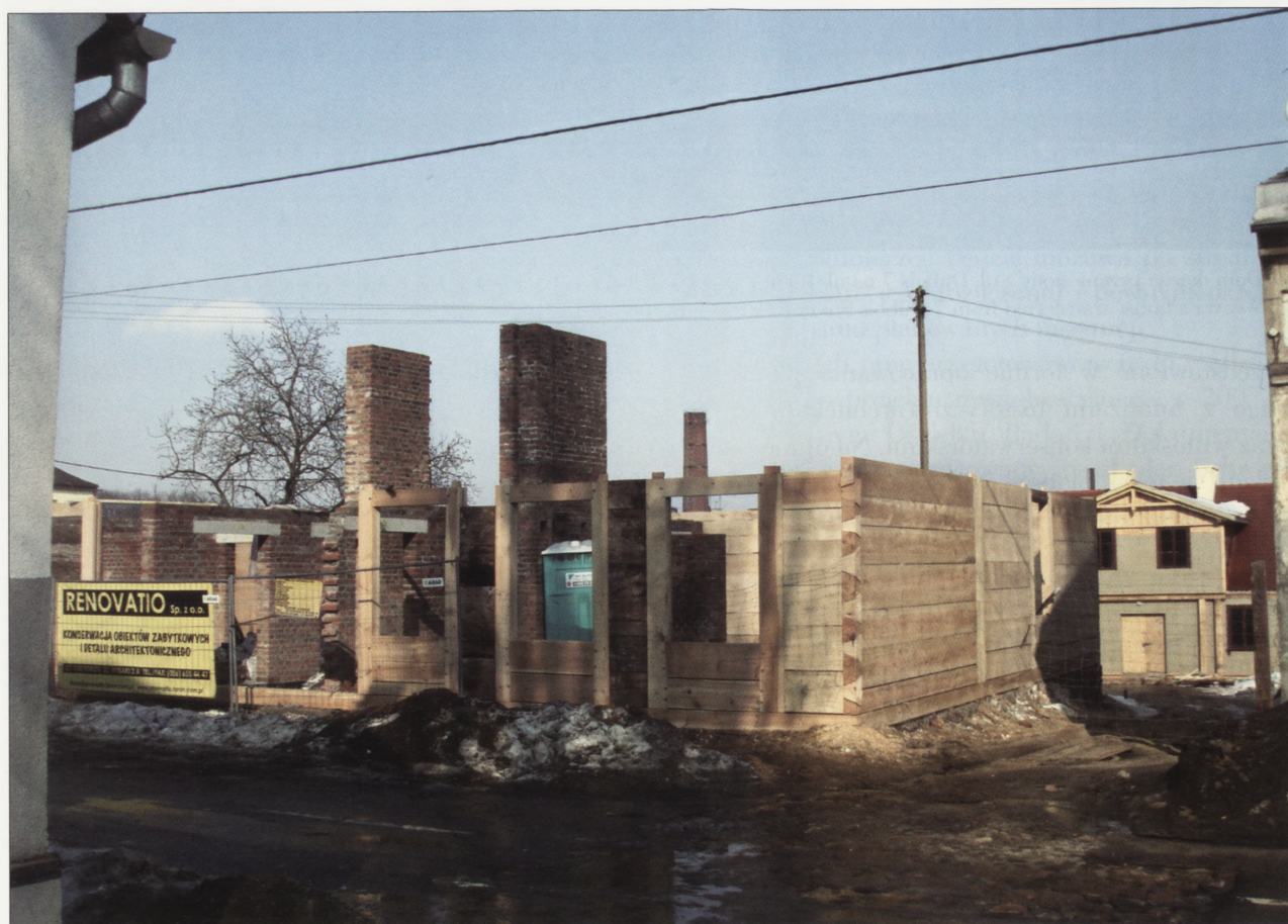
9. Ulica Rembowskiego, prace przy translokacji dwóch domów tkaczy z ul. Dąbrowskiego 7 i 9, w głębi widoczny dom przy ul. Rembowskiego 1 przeniesiony z ul. Dubois 7, luty 2010 r.

wytyczne i wnioski do miejscowego planu zagospodarowania przestrzennego dla samego parku, do opracowywania którego przystąpiono już w 2004 r., zgodnie z uchwałą Rady Miasta 21 . Do tej pory miejscowy plan zagospodarowania przestrzennego nie ma jednak mocy prawnej, co stwarza bardzo trudne warunki działania dla twórców parku. Jak już wskazano na wstępie, do chwili uprawomocnienia się planu wstrzymaniu ulegają postępowania o wydanie decyzji o warunkach zabudowy na danym terenie, w tym wypadku na terenie parku kulturowego. W konsekwencji projekty budowy zastępczych budynków dla mieszkańców drewnianych obiektów, które poddawane są rewitalizacji, pozostać muszą w zawieszeniu do czasu uchwalenia planu zagospodarowania, uniemożliwiając tym samym zmianę sposobu wykorzystania wartościowych budynków zamieszkałych aktualnie przez lokatorów komunalnych i ograniczając działania rewitalizacyjne jedynie do obiektów niezamieszkałych.