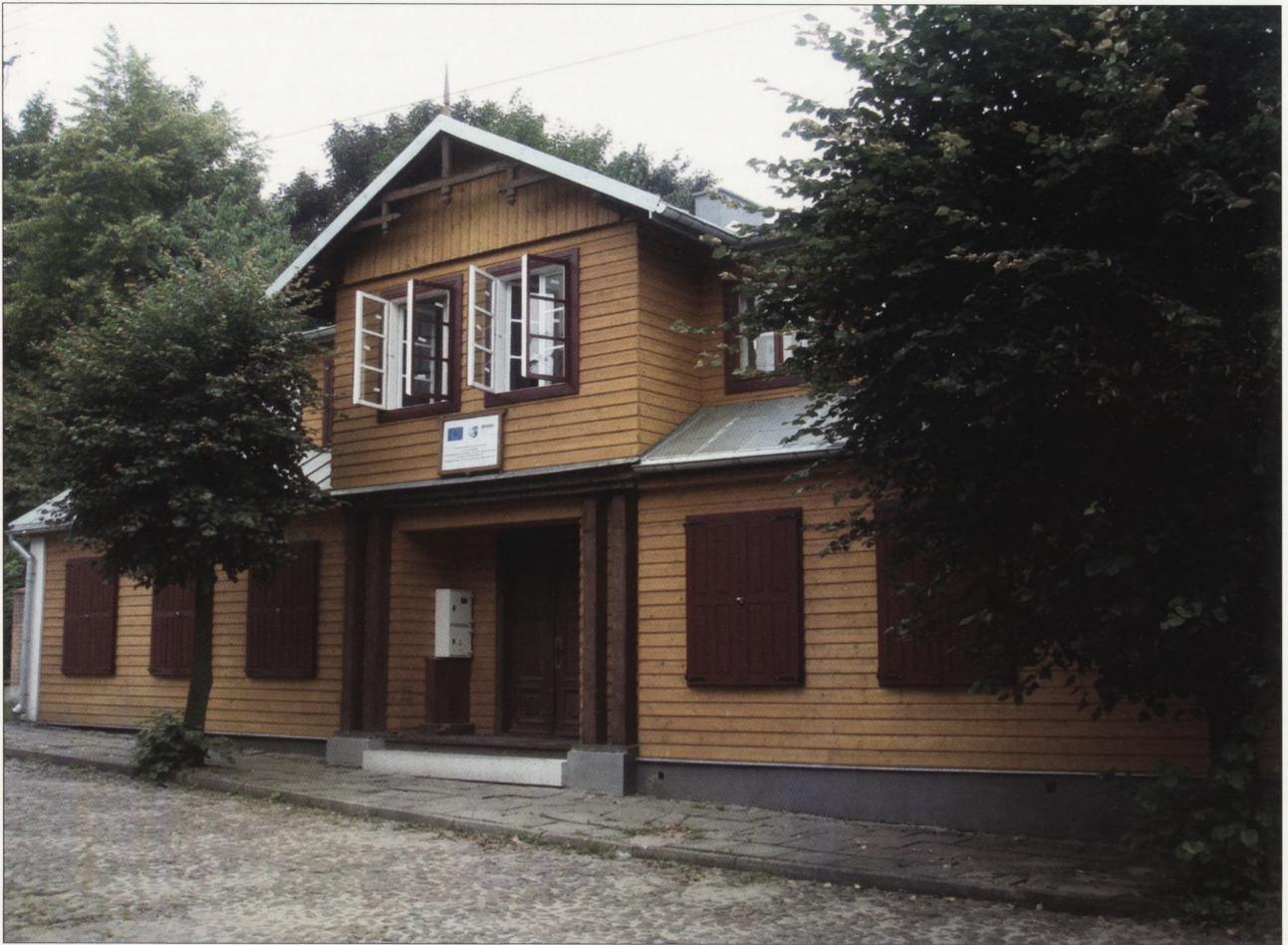
10. Dom tkacza przy ul. Narutowicza 12 po remoncie konserwatorskim przeprowadzonym w 2007 r. z funduszy Zintegrowanego Programu Operacyjnego Rozwoju Regionalnego, sierpień 2009 r.

10. Weaver's house in 12 Narutowicza Street after conservation conducted in 2007 thanks to funds provided by the Integrated Operational Regional Development Programme, August 2009.