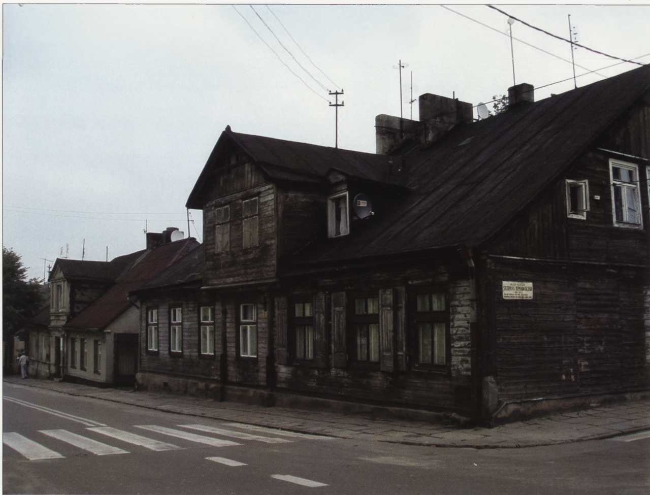
3. Dom przy ul. Narutowicza 5, róg ul. Rembowskiego, sierpień 2009 r. 3. House in 5 Narutowicza Street, corner of Rembowskiego Street, August 2009.

Nowego Miasta. Jej plan oparty został na symetrycznie ukształtowanej siatce ulic, której osią stała się ulica Długa, łącząca rynki Starego i Nowego Miasta. Ten ostatni – centrum Nowej Osady – wytyczony na planie kwadratu o wymiarach 100x100 m. znajdował się na przecięciu dwóch ulic: Długiej i Wysokiej, do których równolegle lub prostopadle poprowadzono pozostałe ulice (z dwoma wyjątkami). Tak racjonalnie zaplanowana dzielnica drewnianych domów i warsztatów sukienników stała się przykładem dla innych ośrodków włókiennictwa w okręgu łódzkim.