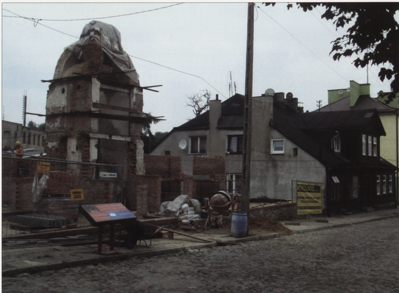
6. Dom przy ul. Narutowicza 6, prace konserwatorskie, sierpień 2009 r. 6. House in 6 Narutowicza Street, conservation work, August 2009.

Autorzy programu uznali, iż dla skutecznej ochrony dziedzictwa kulturowego Zgierza konieczna może okazać się zmiana stosunków społecznych w rewitalizowanym obszarze, polegająca m.in. na przeniesieniu przynajmniej części lokatorów mieszkań komunalnych znajdujących się w zabytkowych budynkach do innych lokali 12 . Jest to najbardziej kontrowersyjny punkt większości programów rewitalizacyjnych, rodzący najwięcej konfliktów, a często decydujący o niepowodzeniu całego przedsięwzięcia. W analizowanym przypadku struktura własnościowa