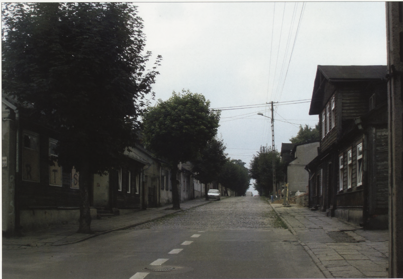
4. Ulica Narutowicza, widok od strony ul. Rembowskiego, sierpień 2009 r. 4. House in Narutowicza Street, view from Rembowskiego Street, August 2009.

stanie technicznym 7 . Budynki te nie były poddawane remontom, a wobec wygaśnięcia z początkiem 2004 r. dotychczasowych miejscowych planów zagospodarowania przestrzennego realna stała się groźba całkowitego ich zniszczenia. Wobec zaistniałego stanu faktycznego, biorąc pod uwagę wszelkie okoliczności prawne, władze miasta Zgierza, po konsultacjach z Łódzkim Wojewódzkim Konserwatorem Zabytków, podjęły decyzję o wprowadzeniu nowej obszarowej formy ochrony istniejącej jeszcze zwartej zabudowy drewnianej.