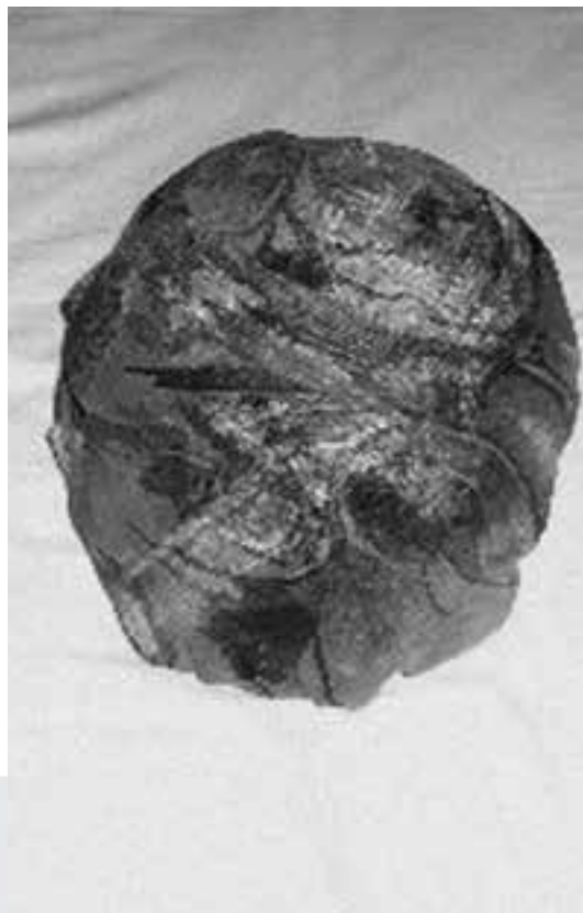
Saint-Louis, Ile Maurice, a' bord du Costa Europa, cabine 6201, 01.02.2009

Meteoryty mówią o podróży w sposób niewidoczny, inaczej niż kartki z widokiem, reportaże. Nie są spojrzeniem na zewnątrz na obcy świat. To raczej zewnętrzne okoliczności podróży stają się impulsem, aby powiedzieć coś o codzienności, o tym, co wewnątrz, o człowieku. Tworzą obcy fragment przestrzeni bez obcości. Meteoryty są prywatną historią wplecioną w zmianę miejsca; z innego czynią własne. O tym, że wydarzają się w innym czasie i przestrzeni dowiadujemy się bardziej z podpisu pod zdjęciem, niż z ich przedstawienia. Ciąg różnic i powtórzeń rytuału zachowuje to, co niewypowiedziane i niewidzialne – może dlatego właśnie są meteorytami, „bo są tajemnicą, koncentracją, podarunkiem, bo zdarzają się rano zaraz po przebudzeniu” 8 . Patrzą na nie jak na moment magicznego, cyklicznego czasu. Powtórzenie i różnica potrzebują wewnętrznej siły, a ta spożywa właśnie we wnętrzu meteorytu...