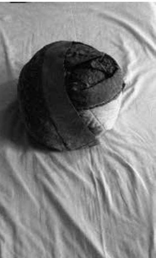
Samarkand, Hôtel Président, ch.308, 07.06.2008

grafii pozwalają nam się domyślać innego miejsca i czasu – podróży. Właśnie to, czego w meteorytach nie możemy dostrzec, to, co niewidzialne, decyduje o ich wyjątkowości, indywidualności, o tym, że przyciągają naszą uwagę. Niewidzialne w tym przypadku, to pewna ukryta historia, która doprowadziła do istnienia tego, a nie innego śladu.