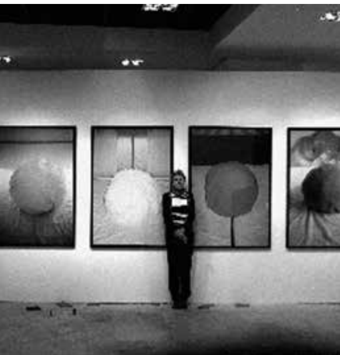
MO et (GM), exposition à l'Institut suisse, Roma, Italie, 2005

strzeni, którą ono stwarza. Z jednej strony przedstawienie prezentuje się we wszystkich swoich elementach, szczegółach, spojrzaniach, ale też w tym rozproszeniu ukazuje się pustka. „Konieczne zniknięcie tego, co owo rozproszenie ustanawia; tego, kogo przypomina i tego w czyich oczach jest tylko przypomnieniem. Ten podmiot właśnie, który jest «Tym właśnie» – został wyłączony. I przedstawienie wolne od tego związku, który je krępował, może ujawnić się, jako czyste przedstawienie” 6 . Zniknięcie czy raczej gra widzialnych i niewidzialnych, dokonuje się jednak po przejściu podstawowego poziomu. Przede wszystkim samo przedstawienie wyłania się dopiero z narracji. Musi powstać pewna historia, aby wyniknęło z niej zniknięcie jej samej przynależne.