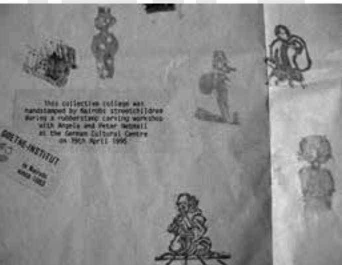
Plakat_netmail i plakat_netmail1 – plakat dokumentujący warsztaty prowadzone przez Angeli i Petera Netmail z wykonaniem stempli z udziałem dzieci ulicy z Nairobi (1995).

Kongres NC 92 przyniósł ważne konkluzje. Uznano, że komunikacja nie musi ograniczać się do poczty, a mail art nie musi się opierać na sztuce. W rezultacie za bardziej adekwatne niż mail art określenie uznano „network”, czyli „sieć”. Pojawiło się również pojęcie „networker” 13 w odniesieniu do uczestnika ruchu. Jak pisze Vittore Baroni, networker nie jest artystą sensu stricto 14 . Jest raczej rodzajem „animatora kultury”, metaartystą, który tworzy konteksty dla