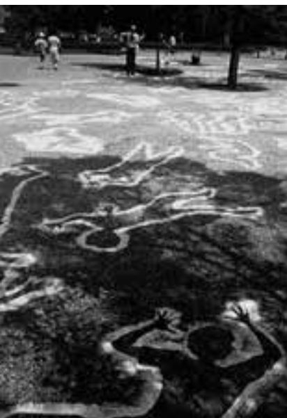
Sh8805 – dokumentacja akcji z Hiroshimy (1988) The International Shadow Project grupy P.A.N.D.

publiczny Internet był – w sensie koncepcyjnym – kontynuacją idei zarysowanych w sztuce poczty.