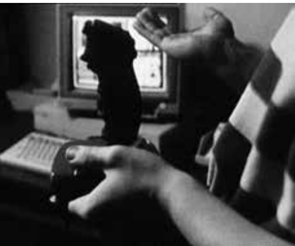
Jak żyć w Republice Federalnej Niemiec – gest władzy pozostający w ukryciu

a jednocześnie, ku czemu kieruje naszą uwagę anonimowość mężczyzny, gest, który pragnie pozostać bezosobowy, niczym głos dobywający się zza kurtyny. To, co w tej scenie dostrzegamy, jest więc quasi-obecnością władzy – widzimy jej efekty na monitorze, widzimy gest zdradzający charakter tej władzy, lecz ona sama pozostaje niewidoczna.