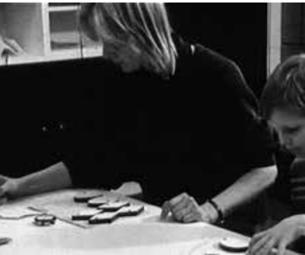
Jak żyć w Republice Federalnej Niemiec – weryfikacja umiejętności

ponowana jest tak, że mamy wrażenie klaustrofobicznego osaczenia dziecka przez rytm upływającego czasu i spojrzenie kamery. Zabawa bardzo szybko zaczyna przypominać pracę przy taśmie produkcyjnej. Chłopiec działa w sposób coraz bardziej automatyczny. Co ciekawe, pedagog nie zmusza go do takiego trybu, przeciwnie, sugeruje mu, by dawał sobie więcej czasu na podejmowanie decyzji. Wydaje się, że to on sam uwewnętrzniając mechanizm egzaminu, którego świadomość nie budzi tu żadnych wątpliwości, zwiększa tempo pracy . Chociaż kamera nie stanowi tu pozornie żadnego zagrożenia, to jednak „pod jej okiem” obserwujemy proces samoujarzmienia, „autotresury”. Trudno wyobrazić sobie lepszą wydajność. Wystarczy sama świadomość obecności kontroli, aby jej obiekt uwewnętrzniał prawo. Żadnej przemocy, minimalne koszty sprawowania nadzoru i przede wszystkim edukacja od podstaw; już nie władza działająca z zewnątrz, narzucana jednostce, ale jednostka jako nosiciel władzy, działającej permanentnie.