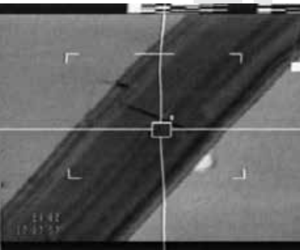
Wojna na odległość – obrazy pozbawione ludzi

W Wojnie na odległość Farocki koncentruje swoją uwagę na charakterystycznym dla obrazów z wojny w Zatoce Perskiej braku ludzi – i to w podwójnym znaczeniu. Paradoksem telewizyjnego przekazu „na żywo”, relacjonowanego „bezpośrednio” z amerykańskich maszyn wojennych, było to, że docierające do nas obrazy niszczonej celów wojskowych pozbawione były realistycznych reprezentacji śmierci; bez rozlewu krwi, bez rannych dzieci i kobiet, bez wstrząsających obrazów „przypadkowych ofiar”. Z produkcji obrazów z Zatoki wymazane zostało ryzyko poruszenia widza. Były to raczej czyste obrazy-dane, obrazy-informacje, wobec których trudno się było ustosunkować, obrazy bez podmiotów, z którymi można