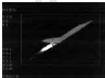
Wojna na odległość

W omawianych powyżej filmach Harun Farocki swoją uwagę koncentrował przede wszystkim na symulacji i związanych z nią technikach kontroli. W Jak żyć w Republice Federalnej Niemiec maszyny widzenia, w sensie zawężonym do techniki zapisu wideo i wykorzystania komputerów, stanowiły jeszcze margines jego refleksji, ale w szerszym ujęciu, jako aparaty ( apparatus ) społecznej kontroli, sprawujące władzę poprzez czynienie „widzialnym” (a więc przewidywalnym, weryfikowalnym i niejako policzalnym), stanowiły podstawowy diagram definiujący obrazowane przez reżysera społeczeństwo. W Obrazach więzień Farocki skoncentrował się na nowoczesnych technikach inwigilacji, wykorzystywanych w tak wydawałoby się odległych, a wręcz antagonistycznych względem siebie obszarach, jak system penitencjarny i rozrywkowy (konsumpcyjny). Spostrzeżenia zawarte w tych filmach należy jednak uzupełnić jeszcze o kluczową dla twórczości Farockiego problematykę obrazu, a konkretnie „obrazów operacyjnych” (technicznych) 20 .