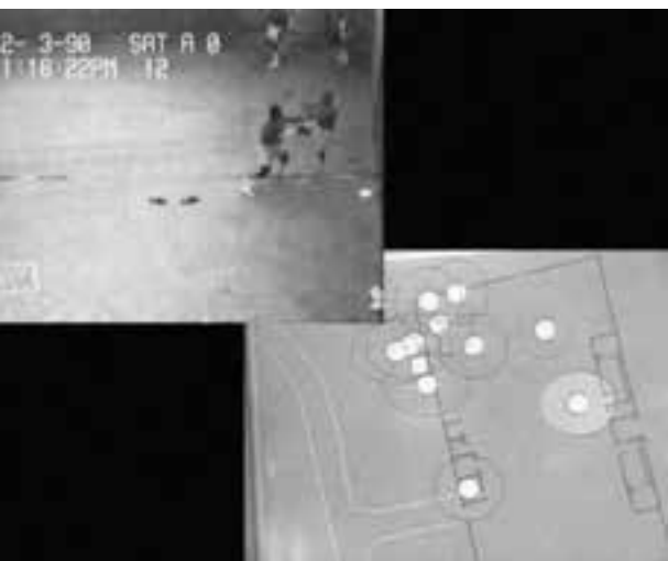
Obrazy więzień – komputerowa reprezentacja więźniów

onitoringu, który służył początkowo do przeciwdziałania kradzieżom, został z czasem zaadoptowany przez strategie marketingowe mające na celu maksymalizację sprzedaży poprzez badanie nawyków zakupowych. W oparciu o materiał zebrany z kamer zainstalowanych w sklepach specjaliści badają ruch konsumentów w przestrzeni komercyjnej, dzięki czemu mogą z większym prawdopodobieństwem kontrolować „spontaniczne zakupy”. Po chwili Farocki zestawia diagram reprezentujący konsumentów z kolejnym, tym razem przedstawiającym ruch skazańców na terenie więzienia. Mężczyźni noszą specjalne opaski, których sygnał pojawia się na monitorze, umożliwiając nie tylko lokalizację skazańców w przestrzeni, ale i szybkie ustalenie tożsamości konkretnego więźnia.