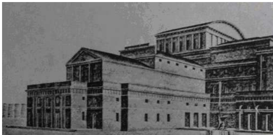
Ryc. 3. Fasada Teatru Miejskiego. Wejście do Teatru „kameralnego” pierwotnie planowano od strony ul. J. Kilińskiego. Brak zgody i naruszenie terenu cerkwi św. Aleksandra, wymusiły na architekcie przeniesienie Teatru „kameralnego” od ul. Skwerowej, proj. C. Przybylski, 1924 r., „Architektura i Budownictwo”, 1936, R. 12, nr 8-9-10 (numer specjalny).