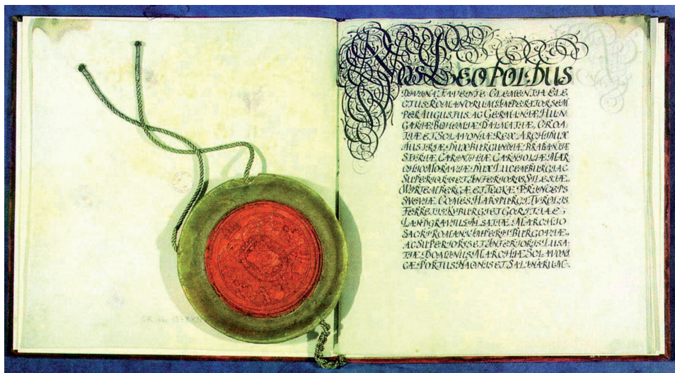
Ryc. 1. Złota Bulla z 1702 r. i majestatyczna pieczęć cesarza Leopolda I

Szkoła ta miała pełne średniowieczne studium w zakresie trivium i quadrivium i była określana jako „fakultet teologiczny”, a w dokumencie papieża Urbana V z 1363 r. określano ją jako „Uniwersytet”. Uważana była za jeden z najlepszych ośrodków oświaty i nauki w ówczesnej Europie Środkowej. Działo się to dzięki znakomitemu kierownictwu i gronu pedagogicznemu. Zgodnie z postanowieniem statutów synodu w Akwizgranie z 817 r. kierownikiem szkoły musiał być „mąż zdolny do udzielania nauki i zasługujący na zaufanie pod każdym względem, a inni nauczyciele również muszą być do zawodu przygotowani i nie budzić zastrzeżeń natury moralnej” 2 .