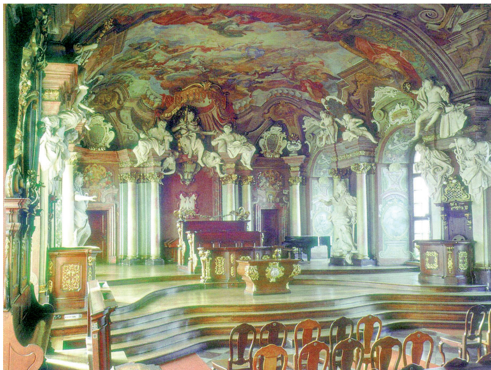
Ryc. 3. Aula Leopoldyńska – widok współczesny