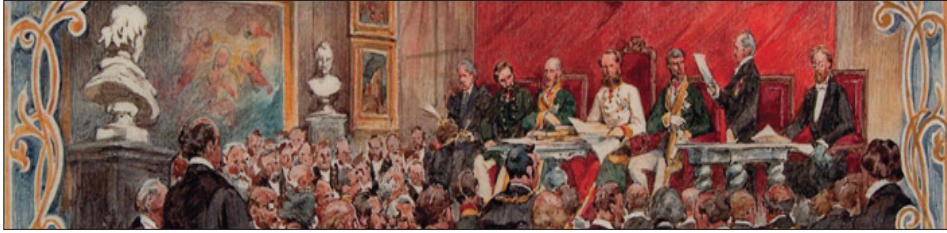
Pierwsze walne posiedzenie publiczne Akademii Umiejętności w dniu 7 maja 1873. Fragment akwareli Juliusza Kossaka.

Karol Ludwik. Z tego powodu posiedzenie inauguracyjne mogło zostać wyznaczone dopiero na 7 maja, kiedy arcyksięcia nic pilniejszego nie zatrzymywało w Wiedniu.