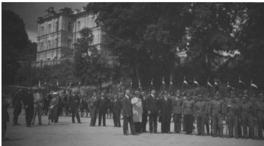
Fot. 2. Uroczystość Związku Strzeleckiego w Krzemieńcu – 6 sierpnia 1933 r.