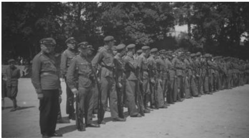
Fot. 1. Uroczystość Związku Strzeleckiego w Krzemieńcu – 6 sierpnia 1933 r.

w Czarukowie. Na terenie powiatu łuckiego wychowanie fizyczne kobiet było prowadzone w trzech oddziałach ZS: Kiwerce, Ławrów i Łuck-Miasto 32 .