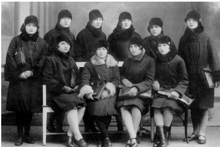
Fot. 2. Uczennice Szkoły Handlowej – okres międzywojenny