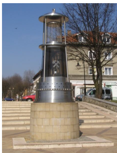
Ryc. 4. Punkt 4: Lampa górnicza przy osiedlu A