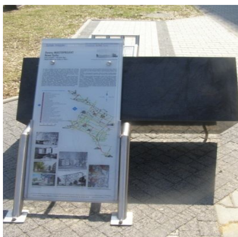
Ryc. 2 i 3. „Punkty informacyjne” na tyskim Szlaku – ławki zawierające tablicę z informacjami uzasadniającymi wybór danego miejsca i przedstawiającą jego krótką historię