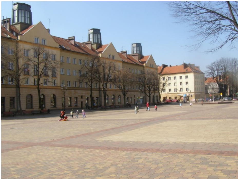
Ryc. 8. Punkt 7: Plac Baczyńskiego