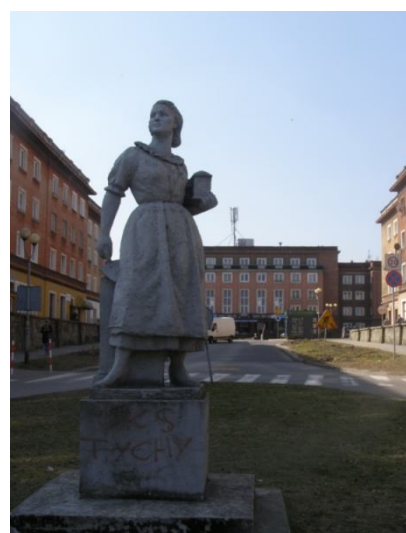
Ryc. 5. Punkt 2: Pomnik przodownicy pracy przy wjeździe na plac św. Anny (osiedle A)