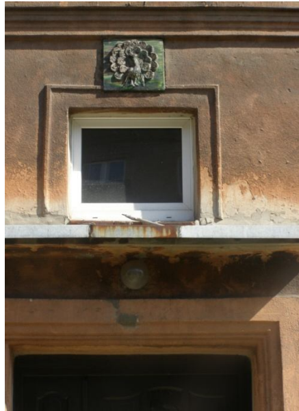
Ryc. 7. Jedna z plaket zoomorficznych znajdujących się nad wejściami do klatek schodowych i bram na osiedlu A