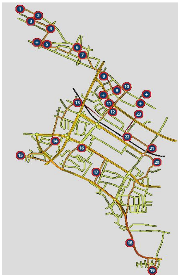
Ryc. 1. Mapa Szlaku Od socrealizmu do postmodernizmu. Unikatowe Nowe Tychy