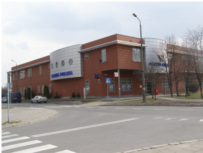
Ryc. 9 i 10. Punkt 22: Poczta główna i budynek przy ul. Darwina 25

Ryc. 4-10 wybrane punkty Szlaku miejskiego – Od socrealizmu do postmodernizmu. Unikatowe Nowe Tychy.