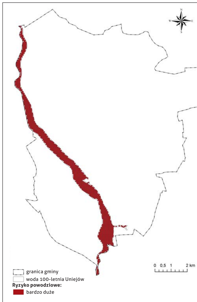
Ryc. 3. Ryzyko powodziowe ogółem według powierzchni zajmowanej przez obszary problemowe na terenie szczególnego zagrożenia powodzią – przykład Uniejowa

W Uniejowie największy wpływ na syntetyczny poziom ryzyka mają tereny chronione, które pokrywają cały badany obszar (ryc. 3). W związku z ekspansją zabudowy w trakcie wystąpienia powodzi na obszarach chronionych może dojść do utraty funkcji ekologicznej i wprowadzenia zanieczysz-