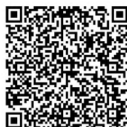
Rys. 3. Wizytówka autorki – kod QR

Za pomocą QR kodu można zapisać m. in. adres URL witryny, jakikolwiek tekst, numer telefonu, adres e-mail, vCard (wizytówka zawierająca imię, nazwisko oraz dane kontaktowe – rys. 3), SMS (numer telefonu, wiadomość), notatkę dotyczącą wydarzenia (nazwa, data oraz czas trwania, opis), współrzędne geolokalizacji (m.in. restauracji, hoteli), wifi network (SSID, hasło, typ sieci).