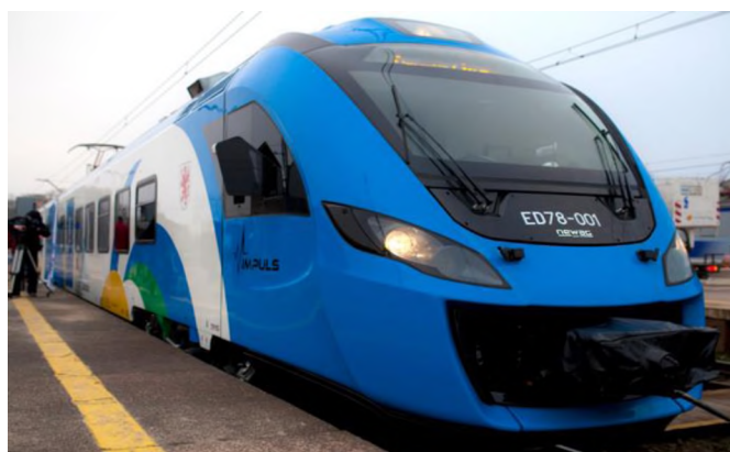
Rys. 1. Przykład pasażerskiego taboru kolejowego do obsługi połączeń międzywojewódzkich organizowanych przez województwa lubuskie i zachodniopomorskie

Nazwa Projektu brzmi Zakup pasażerskiego taboru kolejowego do obsługi połączeń międzywojewódzkich organizowanych przez województwa: lubuskie i zachodniopomorskie . Zakres Projektu obejmuje 14 nowych czteroczlonowych elektrycznych zespołów trakcyjnych, w tym 12 dla województwa zachodniopomorskiego i dwa dla województwa lubuskiego (rys. 1).