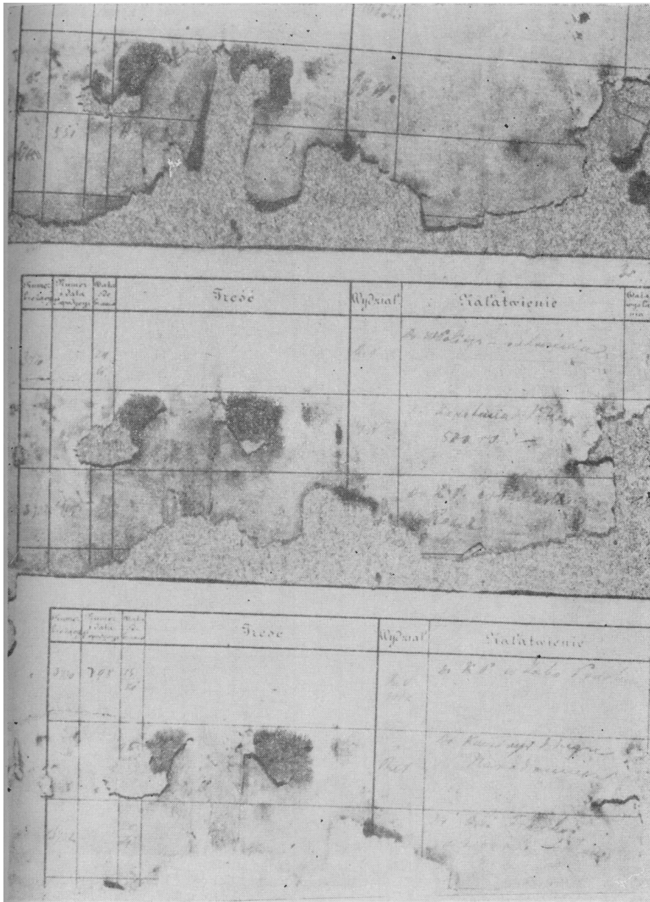
Ryc. 1. Zniszczone fragmenty dziennika korespondencji Rządu Narodowego; numery 3709—3711, 3720—3722, 3730—3732.