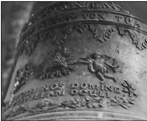
11. Plakietka z wyobrażeniem Oka Opatrzności podtrzymanym przez dwa anioły na dzwonie J.Z. Weidnera w Złotnikach, 1757 r.