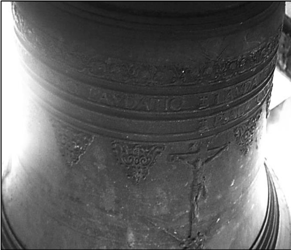
2. Fragment inskrypcji i dekoracji na dużym dzwonie z kościoła parafialnego w Małogoszczu z 1655 r.