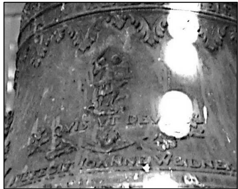
12. Dzwon w Złotnikach z 1757 r., fragment dekoracji płaszcza z plakietką św. Michała Archaniola i sygnaturką ludwisarza