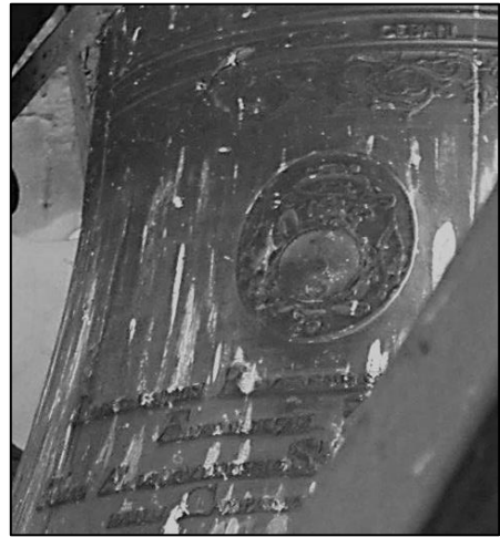
8. Herb Złota Wolność na dzwonie z Jędrzejowa, 1768 r.