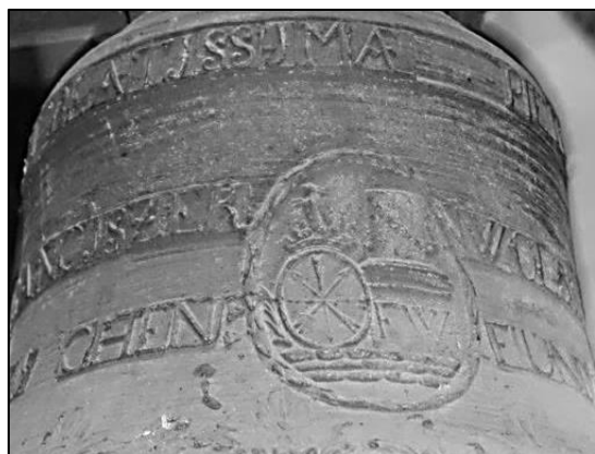
14. Plakietka z herbem Jelita na dzwonie w Rembieszycach, 1798 r.