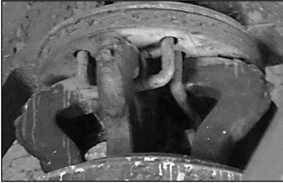
9. Kościół cystersów w Jędrzejowie, dzwon Ernesta Fryderyka Kocha, 1768 r., dekoracja kabłąków korony

mają też znaną z wielu prac sentencję biblijną: „SOLI DEO GLORIA”, datę odlewu oraz sygnaturkę ludwisarską. Na starszym z dzwonów imiona mistrza zostały zapisane tylko w formie inicjałów. Poza tym wyróżnia go plakietka z wizerunkiem Matki Boskiej umieszczona na płaszczu. Drugi zabytek dekoruje przedstawienie Oka Opatrzności 26 .