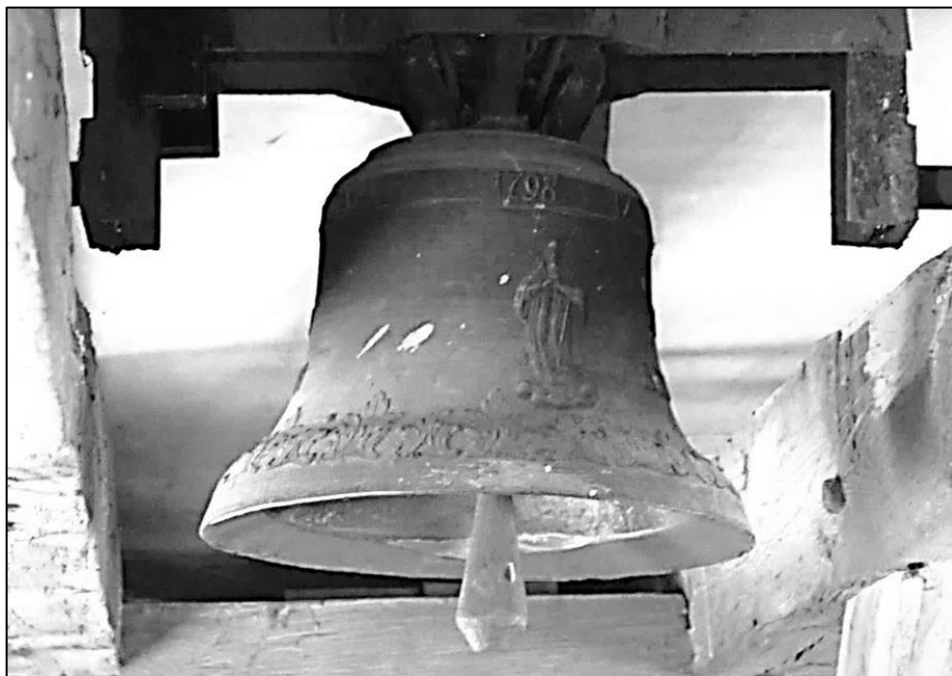
13. Dzwon Piotra Weidnera w wolno stojącej dzwonnicy przy kościele parafialnym w Rembieszycach, 1798 r.