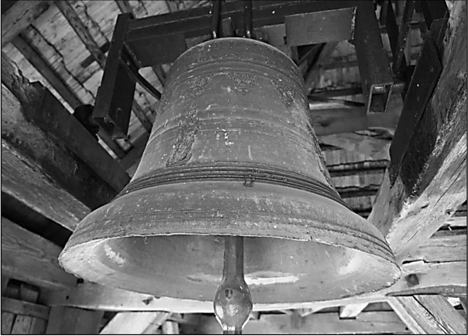
1. Duży dzwon z kościoła pw. Wniebowzięcia Najświętszej Marii Panny w Małogoszczu, Benedykt Briot z Lotaryngii, 1655 r. 13