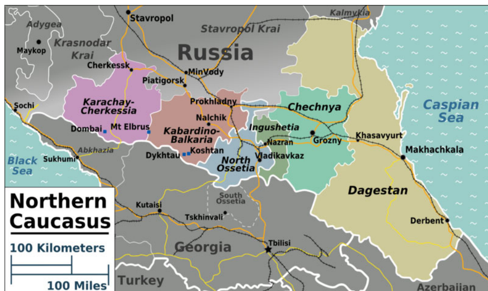
Mapa nr 1: Republiki Kaukazu Północnego i Soczi.