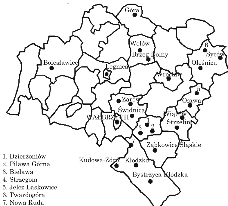
Ryc. 2. Lokalizacja podstref Wałbrzyskiej SSE w województwie dolnośląskim (opracowanie własne na podstawie danych WSSE „Invest-Park”)

W strefie Obwodu Kaliningradzkiego inwestorami są głównie firmy z kapitałem rosyjskim, prowadzące działalność w obszarze przetwórstwa rolno-spożywczego, transportu i nieruchomości (Ministerstwo Polityki Przemysłowej, Rozwoju Przedsiębiorczości i Handlu Obwodu Kaliningradzkiego). W Wałbrzyskiej SSE największymi inwestorami są firmy zagraniczne, które obejmują około 65% inwestycji w strefie. Pozostałe firmy to inwestorzy pochodzenia polskiego. Dominującymi branżami są: motoryzacyjna, sprzętu gospodarstwa domowego, elektrotechniczna i spożywcza (WSSE „Invest-Park”).