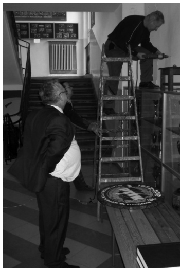
Fot. Robert Mazurek