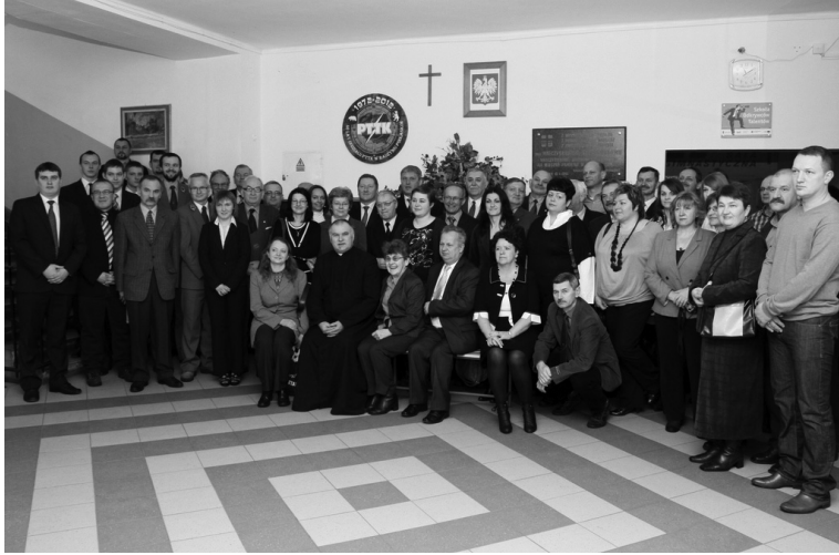
Pamiątkowe zdjęcie uczestników spotkania z okazji 40-lecia Oddziału PTTK w Radzynie Podlaskim (I LO w Radzynie Podlaskim, 19 stycznia 2012 r.)