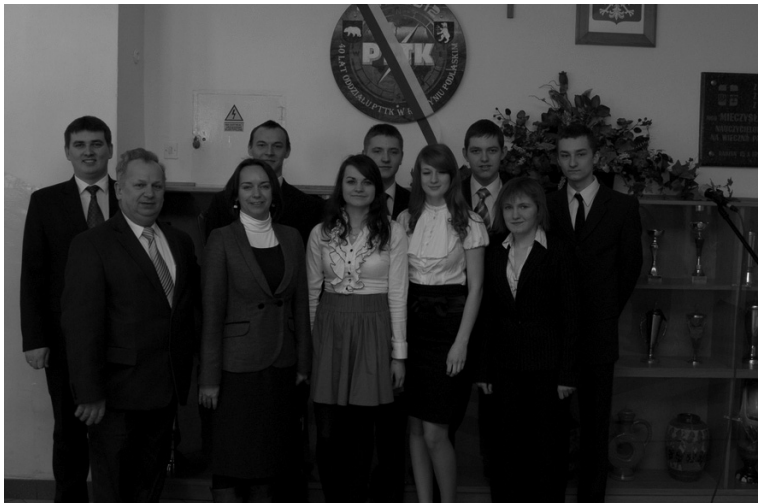
Uczestniczący w spotkaniu nauczyciele i młodzież I LO w Radzynie Podlaskim