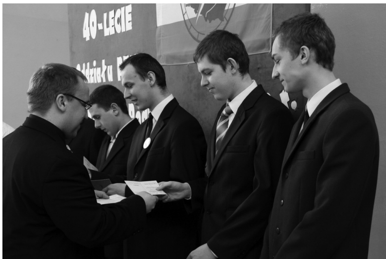
Najmłodsi działacze Oddziału otrzymali Odznaki „Orli Lot”