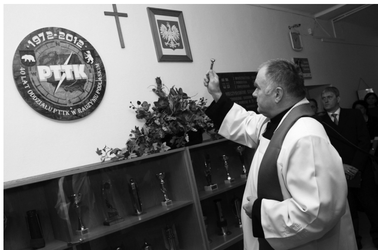
Tablicę poświęcił Ks. Kan. Andrzej Kieliszek, Proboszcz Parafii Trójcy Świętej w Radzynie Podlaskim