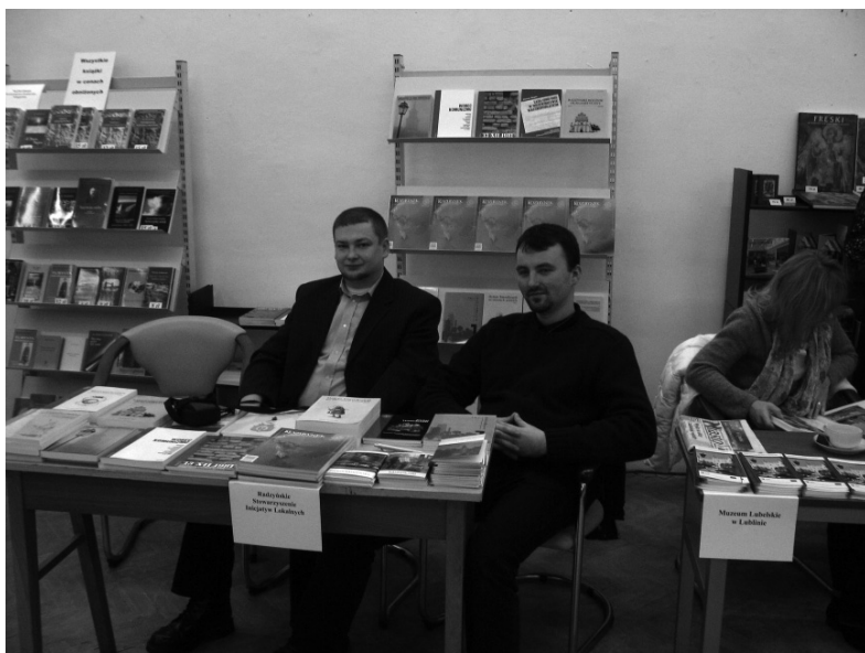
5.12.2008: stoisko RaSIL na Lubelskich Targach Książki