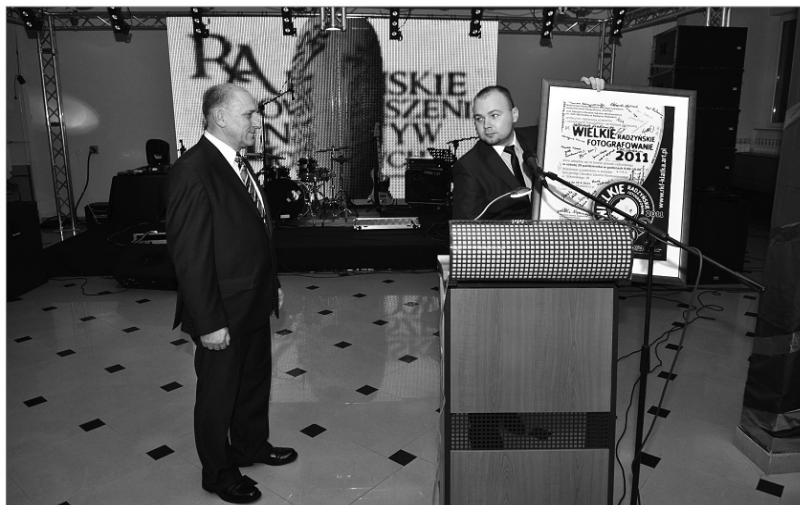
14.01.2012: gala promocyjna RaSIL

W 2011 r. stowarzyszenie kontynuowało swoją działalność. Wyszedł kolejny, dziewiąty już tom „Radzyńskiego Rocznika Humanistycznego”, po rocznej przerwie ponownie wydano „Wschodni Rocznik Humanistyczny”. Z powodów finansowych przestał natomiast wychodzić kwartalnik „Kozirynek” – w 2011 ukazał się jego ostatni numer. Planuje się wszakże jego powrót w 2012 49 .