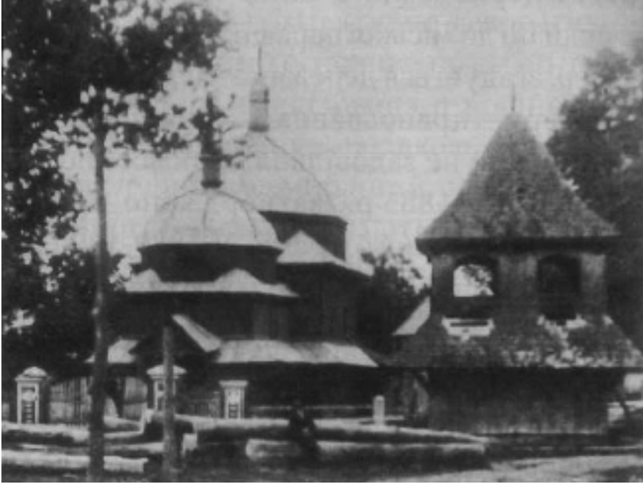
Cerkiew pw. Narodzenia NMP na przedmieściu Dębina 1730-1750, fot. z 1926 r.