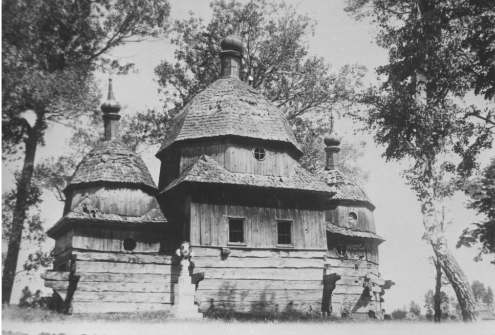
Cerkiewe pw. św. Nicety na przedmieściu Zamłynie, 1759, zdjęcie z 1938 r. Arsena Ryczyńskiego w „Nasza Ojczyzna”, Lwów 1939, cz.5, s. 118.

Z wyposażenia wizytator wymienia puszkę „pro vnrbili” z nakrywką srebrną całą wyłożoną, 2 kielichy z patynami srebrnych, jeden cały drugi wewnątrz tylko wyłożony. Sukienek 2 srebrnych, jedna z tych pozłacana marcepanowa na niej promienie na Panie Jezusie srebrne częściowo pozłacane. Koron 6 srebrnych i 3 alby. Koralików sznurków 7 z dwoma srebrnymi małymi krzyżkami. „Vaseczki pro oleis” cynowe, ale obydwie zepsute. Krzyżów i ampulek cynowych po 2. Dzwonków do elewacji 5. Trybularzy 2. Appartów 6 w tym; kitajkowy biały ze wszystkim, adamaszkowy żółty w kwiaty czerwone, adamaszkowy karmazynowy z kapą zieloną, turkusowy żałobny, na dnie fioletowy w kwiaty różne z kołnierzem atłasowym i atłasowy czarny. Antymisów i korporałów po 3. Zastonek różnych materiałowych 5. Nieokreślonych „tuwalni” 15 sztuk.