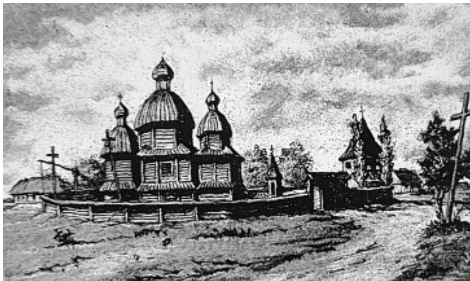
Cerkiew pw. Narodzenia NMP na przedmieściu Dębina, rycina wg rysunku Walerego Elisza w O. Kolberg, Chelmskie. Obraz etnograficzny, T. 1, Kraków 1890, s. 70.

W mieście znajdowały się 3 cerkwie, najpierw prawosławne, a po unii brzeskiej zapewne unickie: cerkiew miejska pod wezwaniem św. Paraskewii-Piatnicy, cerkiew tyszowiecka zamłyńska pod wezwaniem św. Nicety, cerkiew tyszowiecka dębińska pod wezwaniem Przenajświętszej Bogarodzicy.