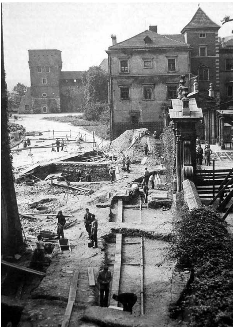
Fot. 1. Kraków – Wawel. Wykopalka prowadzone w 1969 roku w centralnej części wzgórza.

strukcji drewnianych, zalegających w warstwach przed północną elewacją pałacu królewskiego 43 . Dalsze ślady po naziemnych chatkach?, uchwycono na południowy zachód od reliktyw kościoła św. Michała 44 .