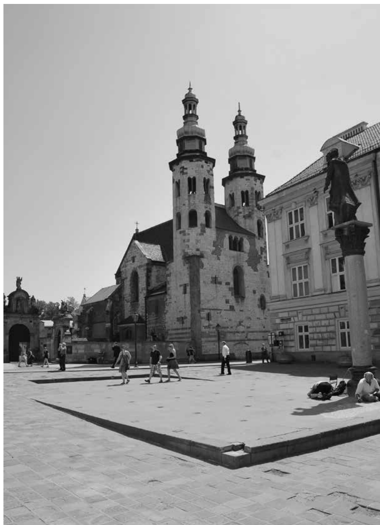
Fot. 3. Kraków-Okół. Plac św. Magdaleny i kościół św. Andrzeja.

nie obiekt usytuowany był na placu św. Marii Magdaleny, około 20 m na północny zachód od kościoła św. Andrzeja. Jego fundamenty zalegały nad warstwami osadniczymi pochodzącymi od poł. IX do XIII w. Pierwsze pisemne wzmianki o nim pochodzą z akt świętopietrza z 1. poł. XIV w., ale za wcześniejszym powstaniem przemawiają romańskie pozostałości w postaci ciosów wapiennych z obwodowych murów nawy, prezbiterium, części ołtarza oraz romańskie płytki posadzkowe po-