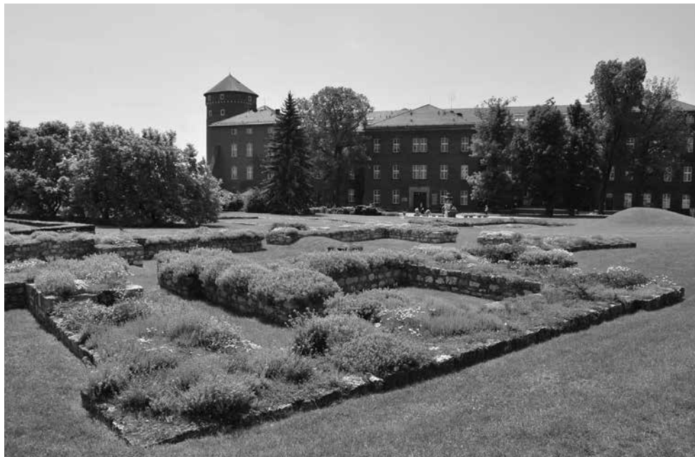
Fot. 2. Kraków-Wawel. Relikty kościoła św. Michała na wzgórzu wawelskim.

Zrelacjonowana wyżej lista kamiennych obiektów Wawelu doby państwowej wczesnego średniowiecza, choć znaczna, może zostać jeszcze w przyszłości uzupełniona. Trwające nieprzerwanie od ponad 60 lat badania architektoniczno-arche-