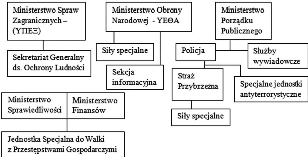
Rys. 2. Grecki mechanizm walki z zagrożeniami asymetrycznymi

We współczesnym świecie, w którym bezpieczeństwo nie jest już czysto militarnym aspektem, należy rozważyć, czy odpowiedzialność za nie powinno ponosić jedynie ministerstwa: Obrony, Spraw Wewnętrznych i Spraw Zagranicznych. W wielu przypadkach nie ma wyraźnej granicy pomiędzy zagrożeniami zewnętrznymi i wewnętrznymi państwa. Ochrona bezpieczeństwa narodowego wymaga teraz koordynacji i współpracy między resortami obrony narodowej i spraw zagranicznych z tzw. służbami wewnętrznymi, np. policją (usługi dla bezpieczeństwa, jednostki reagowania kryzysowego itp.). Istnieje więc potrzeba reformy krajowego mechanizmu, który gwarantowałby ścisłą współpracę i koordynację w celu budowania bezpieczeństwa narodowego w nowej sytuacji międzynarodowej.